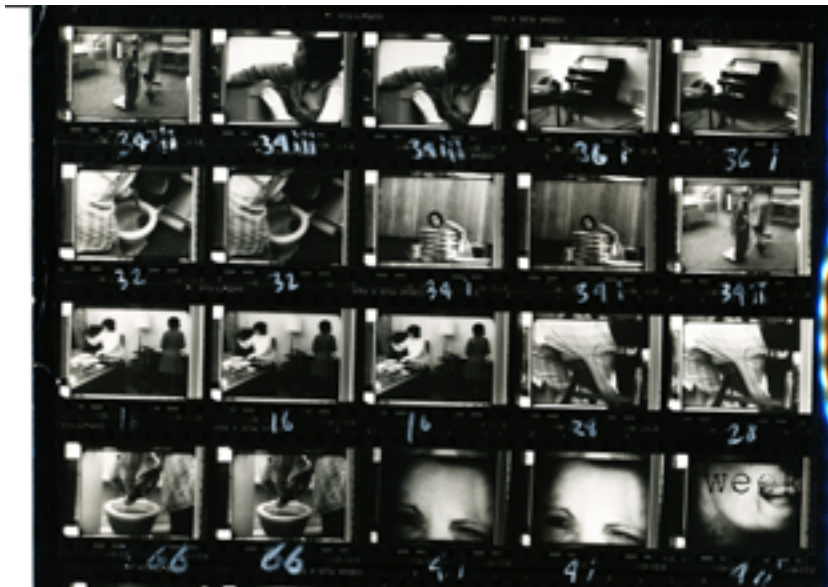
Figura 1. Fotograma del film colaborativo Nightcleaners (Berwick Street Film Collective, UK 1972, 16mm transferido a Beta SP, B&N, sonido)

En el contexto europeo el cine colaborativo tiene su genealogía en las prácticas del cine colectivo. En este sentido, son interesantes las referencias sobre algunas producciones audiovisuales de influencia europea que surgen al final de la década de los 70 en el contexto norteamericano, como por ejemplo la película Berlin/1971 (1980) de Yvonne Rainer.