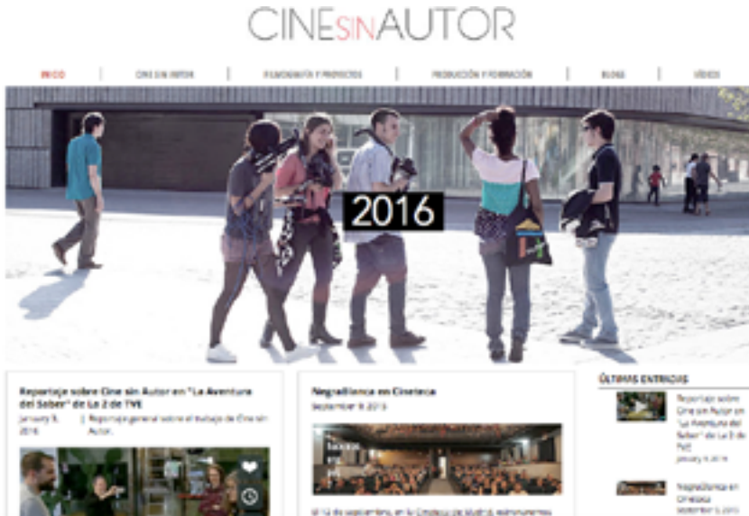
Figura 2. Cine sin Autor. Experiencias de cine colaborativo y cultura participativa

DOI: http://dx.doi.org/10.6035/2174-0992.2016.12.7