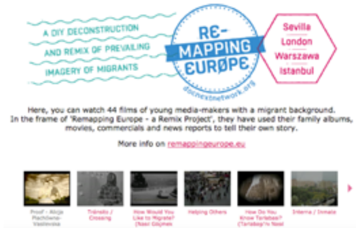
Figura 3. Multiplataforma digital Remapping Europe. Proyecto colaborativo y cultura participativa. Catálogo de films on line.

La necesidad de desnudar la ficción mediática a través de la construcción historias personales y colectivas durante el desarrollo del proyecto colaborativo Remapping Europe plantea: