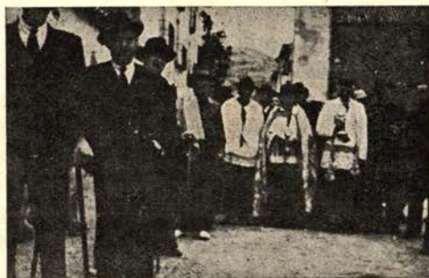
Varios aspectos de la Rogativa a Vallivana.

tes colores brillantes, viejos cacharros de cobre reluciente, repletos de flores, y la presencia de las imágenes familiares, que salen al camino a saludar a la Patrona de Morella. Flores deshojadas alfombran el camino rural, y parece que también los ríos resecos y mudos quieran elevar su murmullo para unirse a la fiesta devota. Una multitud enamorada sigue absorta el ondulante paso de los romeros; cada minuto acrecen los cantos de los sacerdotes.