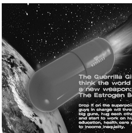
Figura 3. Estrogen Bomb, Guerrilla Girls, 2014.

Una de sus obras más conocidas, por su tono irónico, es un cartel (Figura 2) en el que se hace una numeración de las «ventajas» que supone el ser una mujer artista, entre las más llamativas: trabajar sin la presión del éxito, no tener que asfixiarte con un puro o tampoco tener la necesidad de pintar con un traje italiano. Por otra parte, una obra que es una producción bastante más reciente (2014) pero que contiene la misma dosis de ironía y de crítica hacia el sistema patriarcal es Estrogen Bomb (Figura 3). En este cartel, las activistas hacen una explicación acerca de los efectos que tendría esa bomba de estrógenos, resultando que los hombres dirigentes se pondrían a trabajar en el cumplimiento de los derechos humanos y en acabar con las desigualdades.