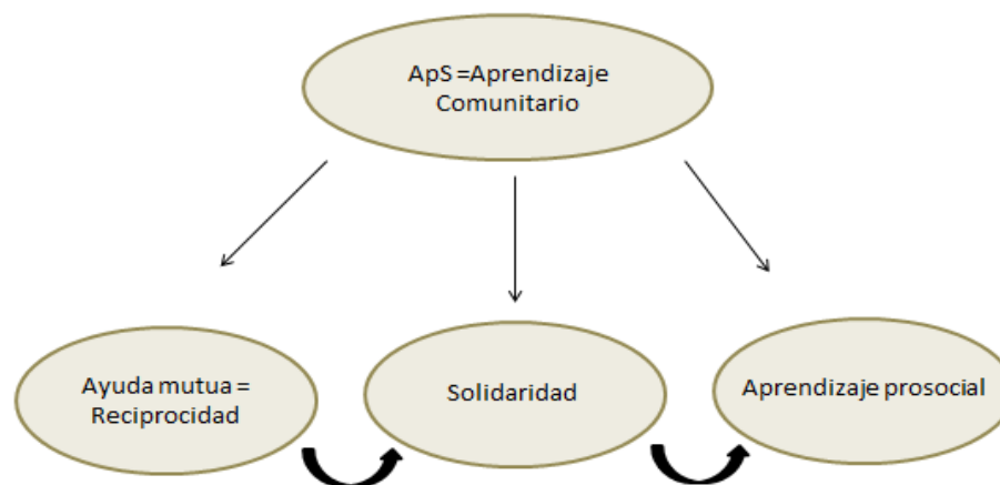
Gráfico 1. El aprendizaje servicio y la solidaridad.