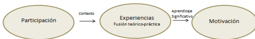
Gráfico 2. El aprendizaje servicio y la vivencialidad en el contexto.

El proceso de reflexión no tiene cabida, únicamente, en un momento puntual del proceso. Es una acción transversal y continuada que no deja de darse durante toda la acción comunitaria: «La experiencia significativa se adquiere mediante procesos de acción y reflexión continuos que avanzan de manera simultánea» (Martín, 2009, p.116). Cada vez que se produce una acción, en ocasiones incluso, de forma involuntaria, acontece una reflexión que dará sentido al proceso y generará aprendizaje, lo cual promocionará la transformación y la configuración personal del alumnado.