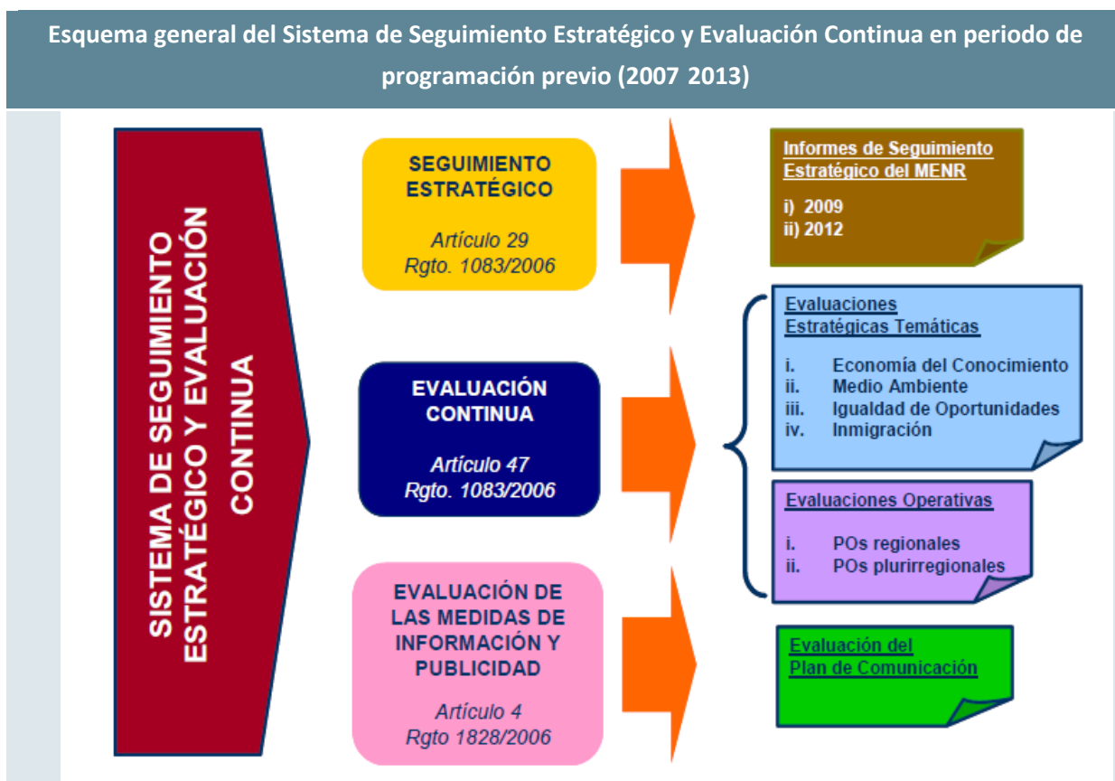
Cuadro 1.1 Esquema general del Sistema de Seguimiento Estratégico y Evaluación Continua en el período de programación previo (2007-2013)

En España, se llevaron a cabo cuatro Evaluaciones Estratégicas Temáticas (EETEC, EETMA, EETIO, EETI). El contenido general de dichas evaluaciones se sintetiza en los siguientes aspectos: