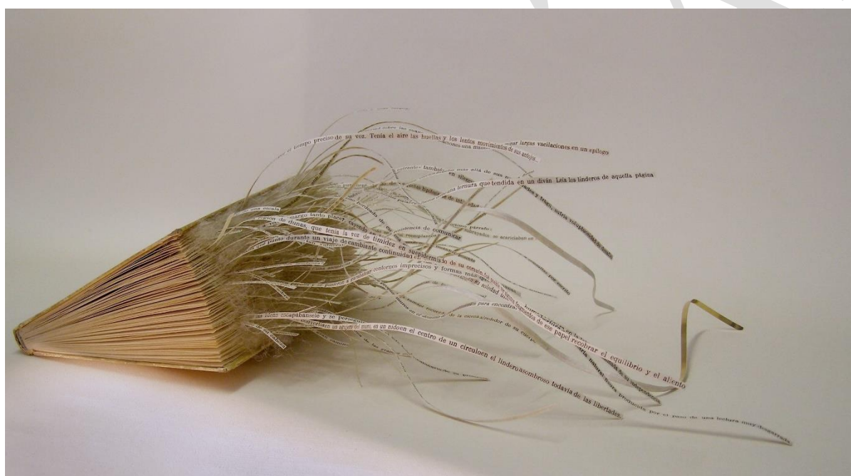
Fig. 5. Serie Asonmbros .

Hasta cierto punto la serie Asonmbros (2007-2009) de Mar Arza me sugiere también pequeños espacios arquitectónicos de los cuales se escapan las palabras. Son los propios libros, esta vez, los que conforman unas estructuras a modos de pequeñas casas y sorprendentes libros objeto de los que surgen y se entrelazan escultóricamente las palabras, al fin y al cabo: «El reino del libro no tiene sus fronteras entre sus tapas sino que se extiende por la realidad circundante, arraigando castillos en el aire» (Arza, 2007-09).