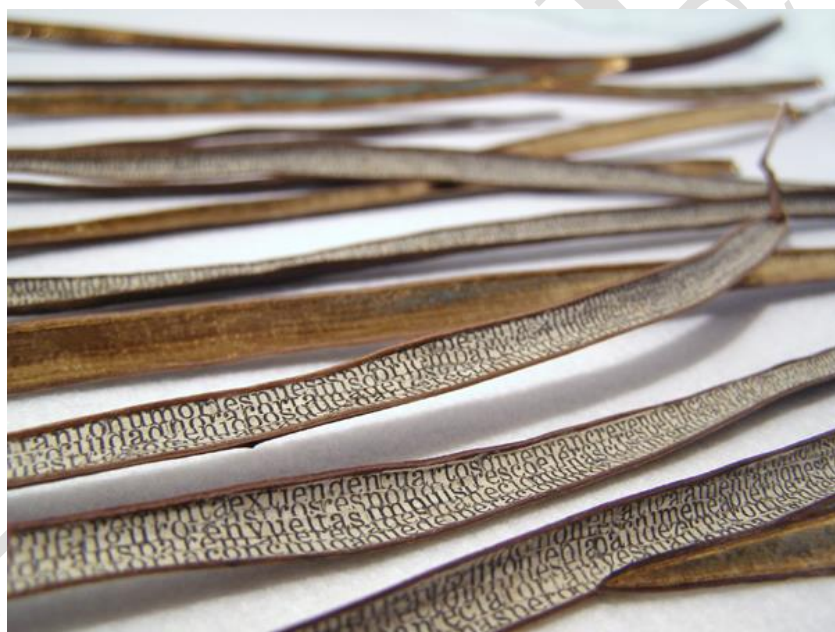
Fig. 4. Serie Femme gaine. Imagen cortesía de la artista y de la Galería Pilar Dolz.

Toda obra de arte que no se deleite únicamente en la pura abstracción cuenta una historia, o al menos un instante petrificado de una historia personal. Pero, vehiculando los significados, se sitúa una forma sin la que éstos no serían arte sino simplemente discurso. Es esa forma, también, lo que me impacta del trabajo de esta artista. Visualmente me emocionan las páginas de libros con palabras tachadas de las que, sin embargo, se conservan rabillos que configuran otro peculiar lenguaje que a veces adquiere todos los tintes de una partitura. También me parecen plausibles hallazgos como Incís (de nuevo el corte y lo que se sitúan detrás de él). Inevitablemente vamos al espacialista Fontana, quien en Concetto Spaziale-Attesa , de 1964-65 traza, en el lienzo en blanco, una herida que le recorre verticalmente. En Incís , idéntica herida, pero unos bordes que no dejan entrever el vacío, sino que de ellos se desliza —piel rasgada— un fragmento de papel donde de nuevo se inscriben las palabras. En cualquier caso, en ambos asistimos a la violencia del corte en un espacio poético. Pero, frente al vacío de Fontana, la palabra de Arza como parte de una nada que de pronto se ha puesto a hablar.