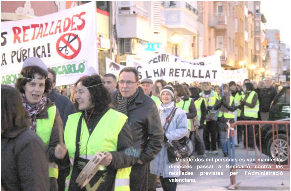
Més de dos mil persones es van manifestar dimecres passat a Benicarló contra les retallades previstes per l'Administració valenciana.