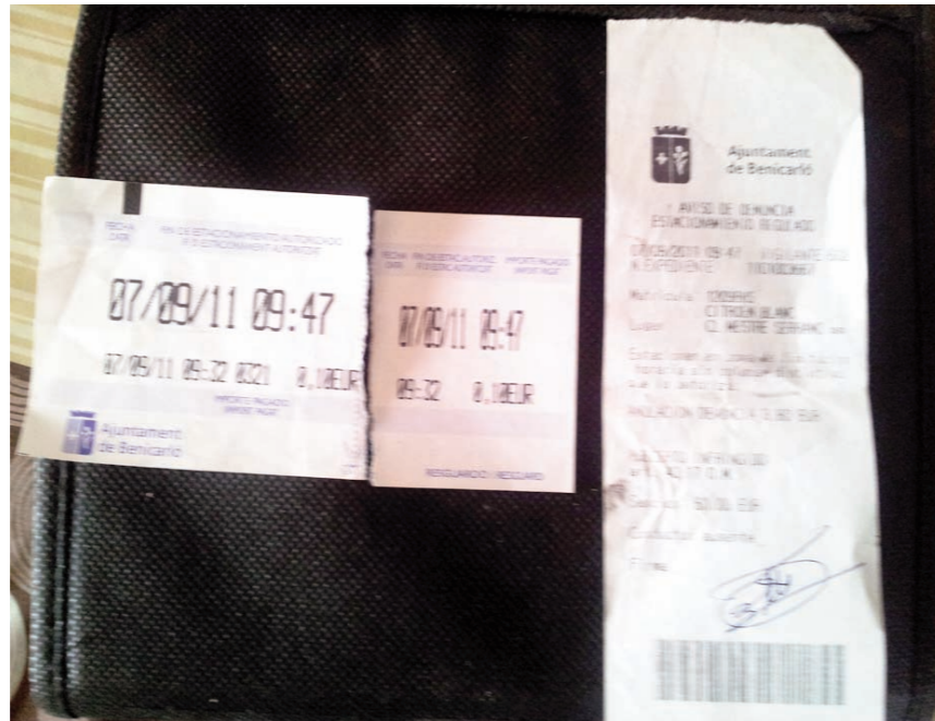
Fa quinze dies vaig ser víctima de l'extrema ortodòxia dels agents de l'ORA a Benicarló. Després d'haver renovat el ticket un cop, quan finalment vaig anar al cotxe, vaig vore que m'havien agraciat amb una multa de 80 euracos. L'hora de la multa era les 09:47 (adjunto foto), exactament l'hora en que acabava el tiquet d'estacionament!

Fa quinze dies vaig ser víctima de l'extrema ortodòxia dels agents de l'ORA a Benicarló. Després d'haver renovat el ticket un cop, quan finalment vaig anar al cotxe, vaig vore que m'havien agraciat amb una multa de 80 euracos. L'hora de la multa era les 09:47 (adjunto foto), exactament l'hora en que acabava el tiquet d'estacionament! Ni un segon de marge vaig tindre per anar a la maquineta a tornar a renovar. Vista la situació, em vaig apropar a l'agent i li vaig dir "de què vas!?". Amb la prepotència que dona ser l'últim de l'escalafó de la jerarquia d'empreses amb subcontracte municipal i haver tingut família treballant a l'Ajuntament, em va dir que anara a queixar-me a la Casa de la Vila. Un cop allí, en informació vaig exposar, indignada, el meu cas. Encara que vaig comptar amb la solidaritat del públic que feia cua – tots tenien alguna "anècdota que contar sobre l'ORA i l'agent en qüestió –, em van dir que allí no era on havia de reclamar, que havia d'anar al tuguri que l'empresa concessionària de l'ORA té en les masmorres del pàrquing de la Plaça de la Constitució-de-quita-i-pon. Cap a Mordor que vaig anar, només per a trobar-me amb llargues "que la persona que s'encarrega d'això no està ací i li has