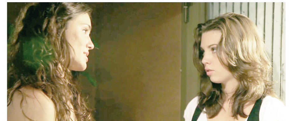
En el capítol 1 de "Líneas", una jove aspirant a escriptora arriba a la nostra comarca.

Et recordem que la sèrie de televisió "Líneas" s'emeta en l'espai televisiu "Anem de Bòlid" en C56 i en TVCS. L'estrena setmanal es la nit del dijous.