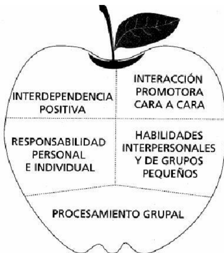
Figura 1. Los componentes esenciales del aprendizaje cooperativo. Fuente: El aprendizaje cooperativo en el aula. (Johnson, Johnson y Holubec, 1999)