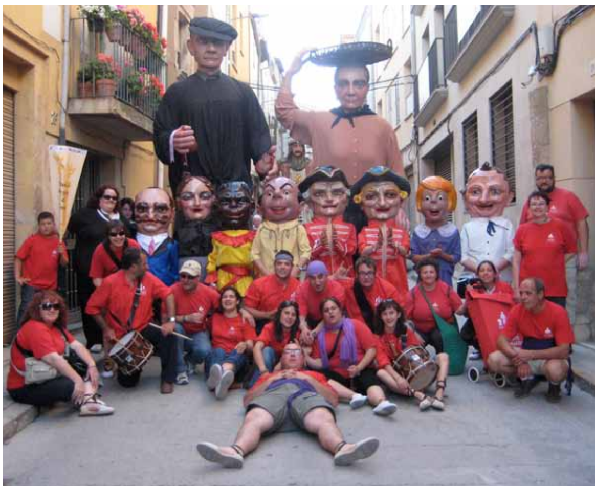
Una vegada més, la Colla de Nanos i Gegants de Vinaròs va participar en una gran trobada