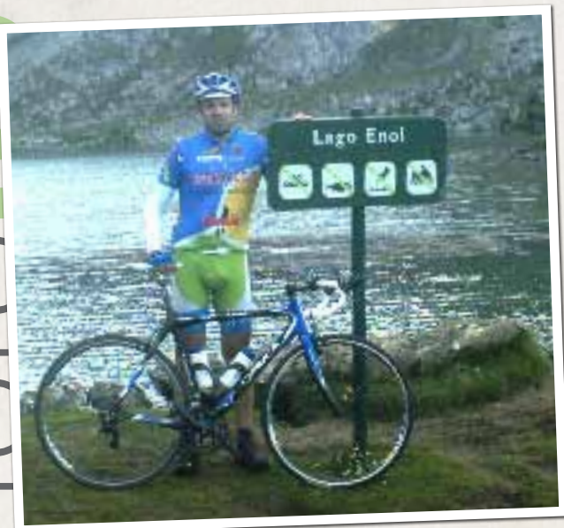
Clásica Clásica Internacional Lagos de Covadonga 2009