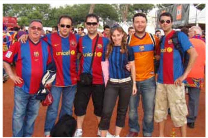
Campions Vinarossencs en la final de Roma