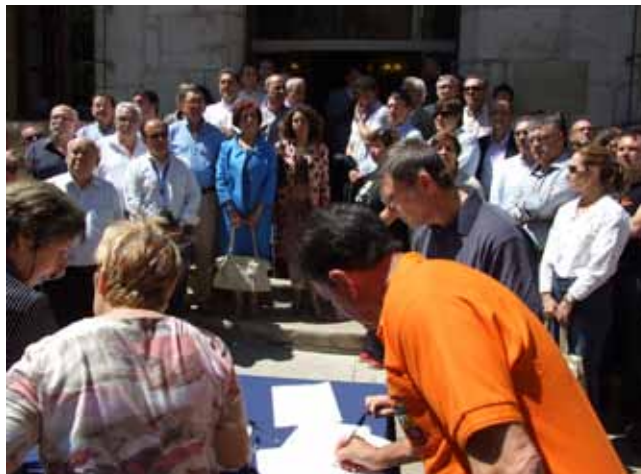
Ciutadans i representants polítics van signar el manifest de Morella. Les firmes seran remeses al Ministeri de Foment