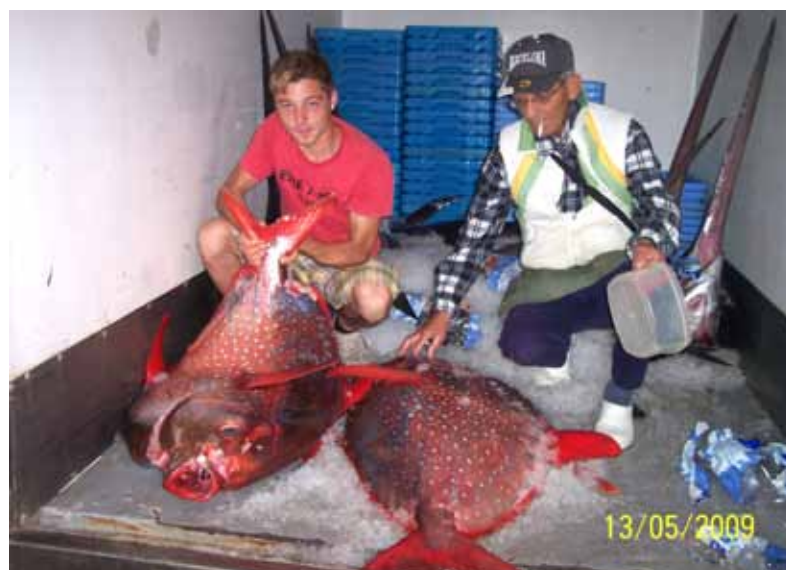
Dos ejemplares rosáceos de luna real

La coloració predominant és groc daurat i ataronjat. És molt carnívor. Es nodreix menjant xicotets organismes planctònics, que atrapa amb els tentacles. Es reproduïx a finals de l'hivern i la reproducció és sexual. Els pòlips aïllats tenen un únic sexe, mentre que els nombrosos grups són hermafrodites. Ovípars. Després d'una setmana entre el plàncton, els ous es fixen sobre el substrat a través del disc pedi que tenen a la base, així s'ancora per resistir els forts corrents o mareas, fins a fons de 200 m.