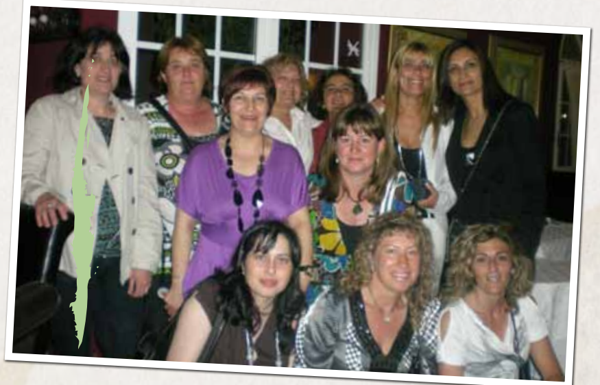
Sopar de mares de cinqué de primària de la Divina Providència