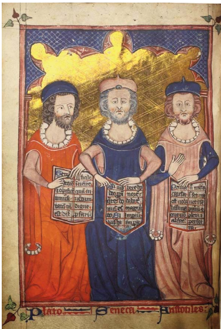
Plató, Sèneca i Arstòtil en una miniatura dels Devotional & Philosophical Writings (1325-1335) de la col·lecció de William Hunter que va llegar a la Universitat de Glasgou

La influència de la primera versió catalana no es limità al castellà. Unes dècades després, probablement al segon terç del segle XV, un altre traductor féu servir també aquella versió i el text llatí per oferir les epístoles 1-29, amb un davantal que conté una adaptació d'una carta de l'humanista italià Coluccio Salutati. Un comentari escrit en llatí i amb profundes implicacions filològiques fou degradat a la categoria de pròleg anònim en aquesta segona versió catalana, igualment anònima, de l'epistolari a Lucili. Malgrat això, no li podem negar, al responsable, una certa decisió a l'hora de fer servir els diversos textos i mitjans al seu abast per tal d'oferir un text entenedor. I això, en el context que he mirat de descriure abans, dominat per una tradició poc innovadora, és tota una declaració de principis, malauradament no completada.