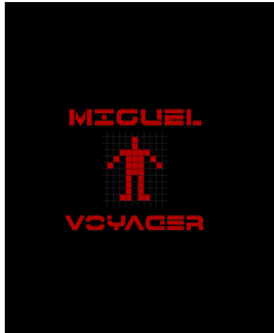
Título del falso documental

Para la tipografía buscamos una que se asemejara al estilo del mensaje y decidimos mantener el color rojo de la silueta de la figura humana.