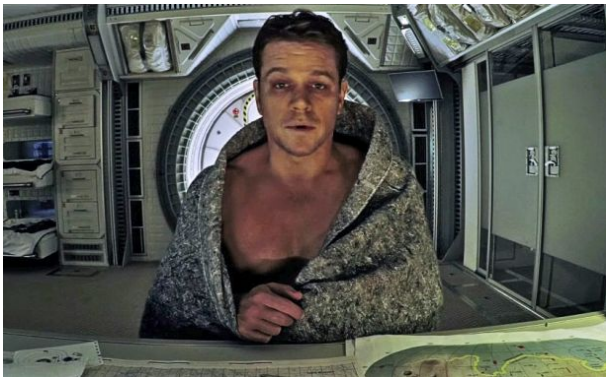
The martian (2015) Riddley Scott