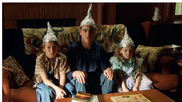
Señales (2002) M. Night Shyamalan