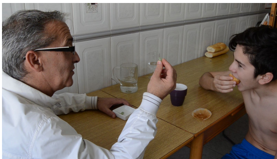
Miguel Voyager (2016)

La última referencia visual que vamos a mencionar es la que tiene que ver con la composición de los planos. La mayoría de tomas de nuestro trabajo no han contado con una dirección artística depurada. Podemos ver que, además de los personajes, aparecen en escena objetos que no aportan nada a nuestra narrativa audiovisual generando así una sensación de “dejadez” por nuestra parte al no tener en cuenta que pueden estropear el plano. Una referencia en este aspecto son programas televisivos como Conexión Samanta (2010-actualidad) o ¿Quién vive ahí? (2010-2012). En ellos la cámara se mete en las casas y en los lugares más personales de la gente y la dirección de arte pasa a un segundo plano para buscar la sensación de telerrealidad.