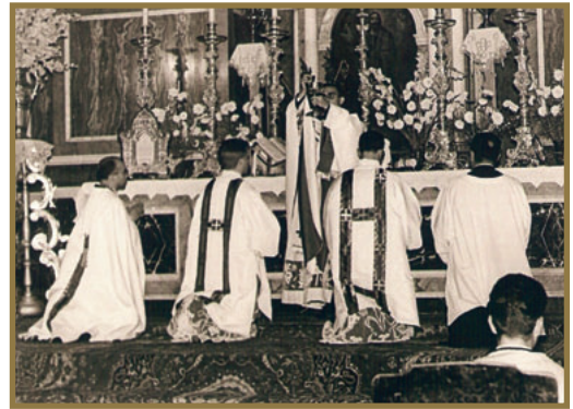
Primera misa en la Arciprestal.

Y las obras iban a paso lento, quizá porque el proyecto fue demasiado alegre para la penuria de los tiempos; pero iba levantándose con las pláticas del incansable fraile y las limosnas de los que buenamente podían ayudar, por más que los que podían, ¡tenían tantos frentes propios a los que acudir...!: ¡una peseta para