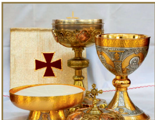
Vasos sagrados para la Eucaristía.