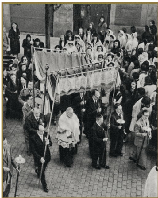
El paso del Santísimo en las calles de Barcelona es reverenciado por los fieles.

hoy al ver los rencores con que pueblos y naciones se odian a muerte.