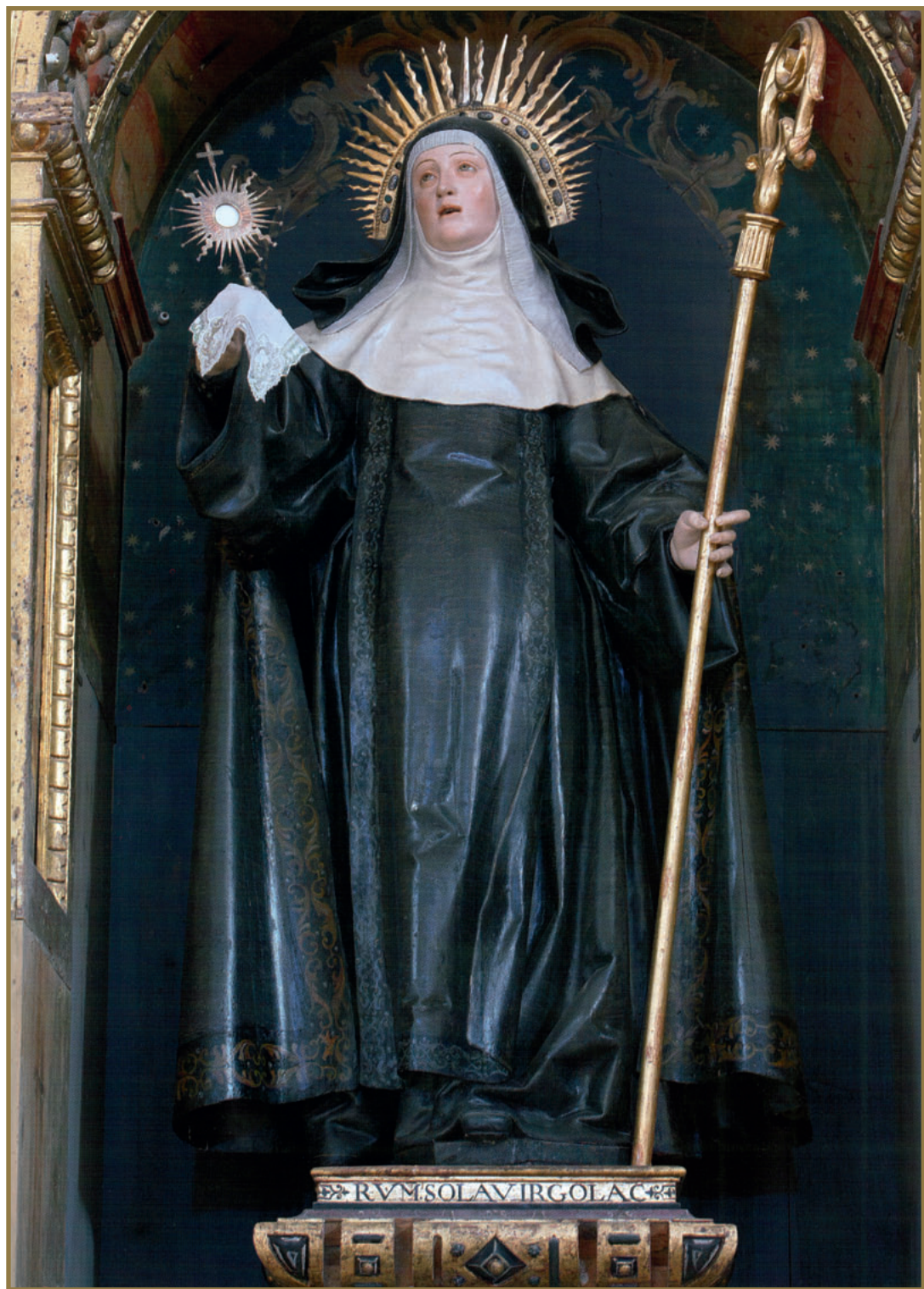
Imagen de Santa Clara hacia 1628, obra de Gregorio Fernández. Monasterio de Santa Clara MM. Clarisas. Medina de Rioseco (Valladolid).