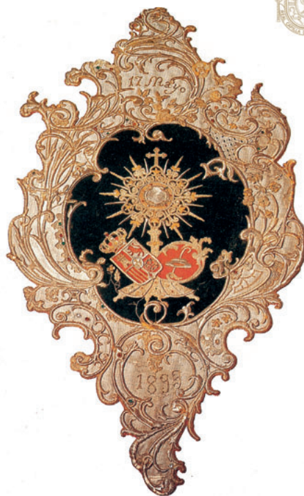
Estandarte de San Pascual con el Santísimo Sacramento. Estrenado en 1899.

La Eucaristía sólo se entiende desde la Acción del Espíritu Santo. La Iglesia, Esposa de Cristo, está llamada a celebrar día tras día el banquete eu-