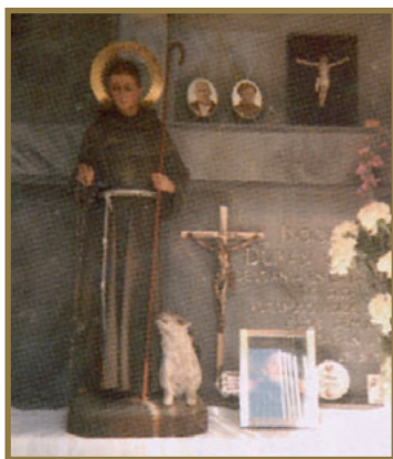
San Pascual en el Panteón.

Después de su fallecimiento su hija quiso cumplir el deseo de su madre quien en el lecho de muerte dijo: “San Pascual es mío y siempre estará a mi lado”, así que trasladó la imagen al panteón familiar donde reposan los restos de esta gran devota. Unos pocos meses des-