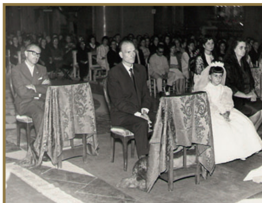
Primera Comunión de una de sus hermanas.

¡Hoy todo ha cambiado menos Dios, sus ángeles y sus santos! En estos Cincuenta Años un servidor ha recorrido el camino del Señor en la Iglesia como: Vicario de Nules (inauguramos la Iglesia parroquial entonces, octubre 1964, Bodas de Oro ahora); Cura Ecónomo de Sueras y Encargado de Alcuñia de Veo y Veo (1966); Prefecto, Superior y profesor del Seminario de Segorbe y Vicario de la Parroquia de S. Pedro (1970); Arcipreste de Albocàsser y Encargado de Villar de Canes y Los Rosildos (1972); Cura Ecónomo de Las Alquerías del Niño Perdido de Vila-real (1977); Párroco de Sueras (2a vez) y Encargado de Villamalur y Ayódar (1981); Párroco “in sólido” de la Arciprestal S. Jaime de Vila-real (1993), Prior de la Muy Ilustre Cofradía de la Purísima Sangre y Ntra. Sra. de la Soledad de Vila-real, Director de los Luíses y Subdirector de la Asociación de Hijas de María del Rosario; siendo en sus tiempos Vice-consiliario diocesano de la JARC y del Movimiento Junior, Director Diocesano de Tarsicios, Profesor de Religión (26 años) en el Instituto Sierra Espadán de Onda. Y últimamente, cuando se publicará esta reseña, que no quería ser biográfica: Adscrito de la Arciprestal S. Jaime de Vila-real y Rector de la Capilla Episcopal del Santísimo Cristo del Hospital de Vila-real.