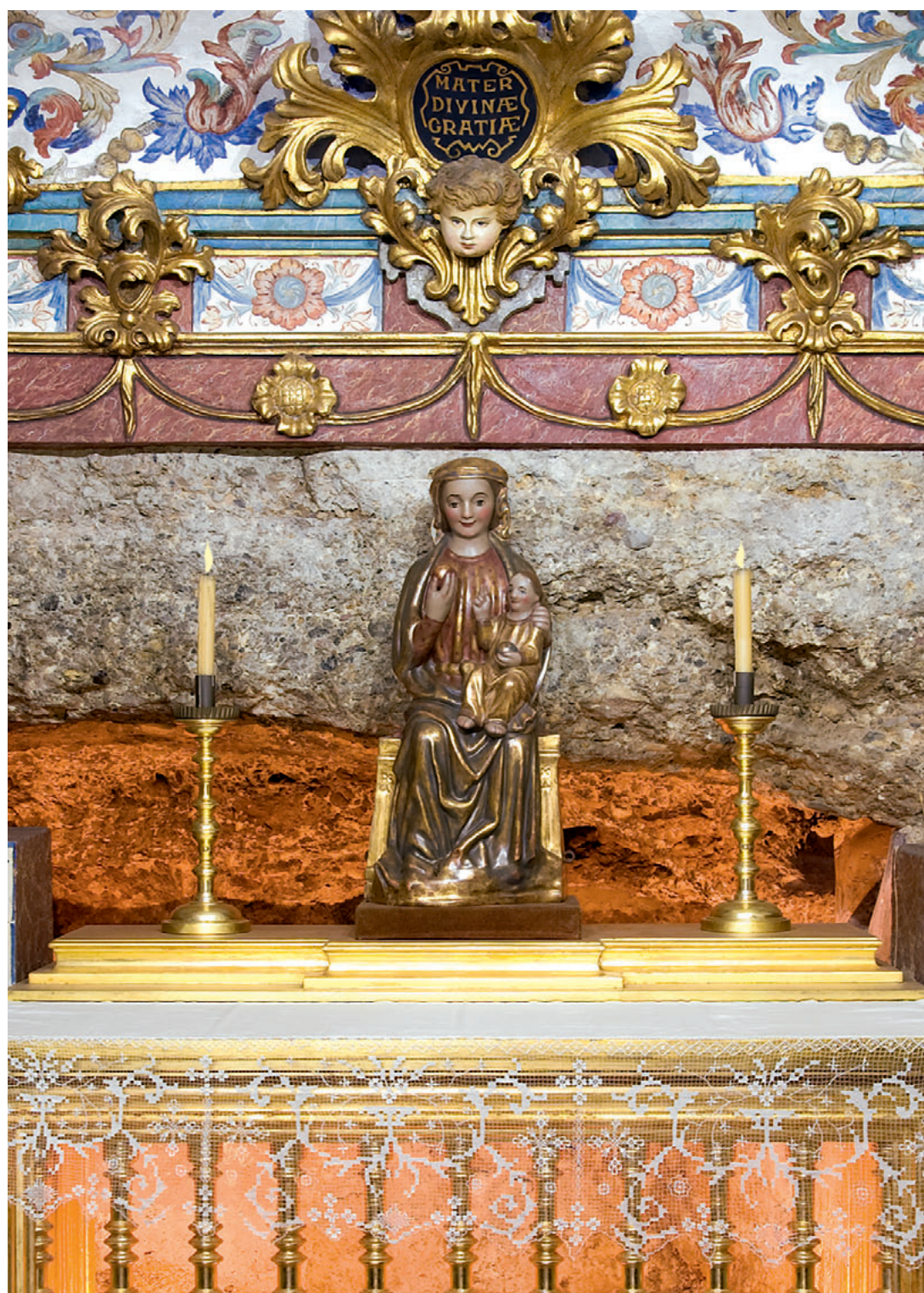
Imagen de Ntra. Sra. de Gracia en la cueva de la aparición de su Ermita. Obra realizada por Vicente Llorens Poy.