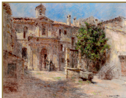
Capilla de los "Penitentes Grises" en Aviñón.

su sorpresa, encontraron que el pasillo, desde la puerta hasta el altar, estaba completamente seco.