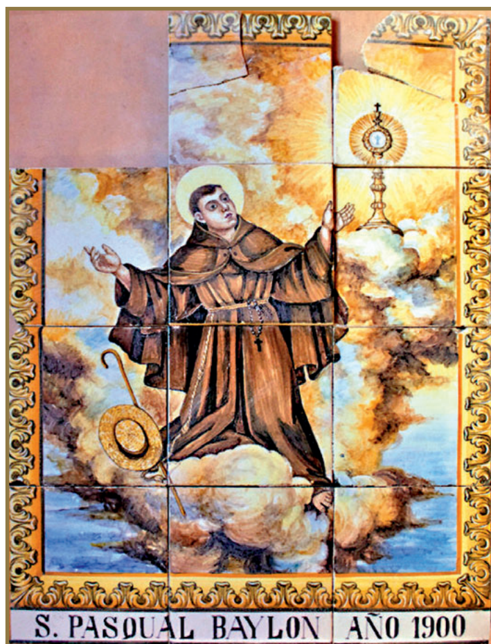
Cerámica con la imagen de San Pascual en el pueblo de Vilavella.

(*) Ferri Chulio, Andrés de Sales. Iconografía popular de San Pascual Baylón. Ed. Caja Rural Coop. Católico Agraria. Vila-real 1992. pp. 32-35