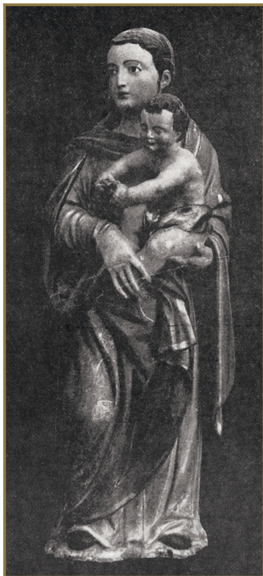
Imagen de Ntra. Sra. del Rosario que presidía el altar de la Iglesia de San Pascual, desaparecida en la Guerra Civil.

Villarreal demostró cumplidamente su amor al Santo y su atención a los romeros, engalanándose de la mejor manera que pudo. Toda la población, sus calles y plazas, edificios públicos y particulares, templos y demás, ostentaban un derroche de artísticos adornos a la veneciana, patrióticas colgaduras rojas y amarillas, arcos triunfales y enamadas; de noche una espléndida iluminación eléctrica lo embellecía todo. Danzas pastoriles, comparsas, cabalgatas y carrozas, retretas, certámenes artísticos y literarios, conciertos, bailes, fuegos artificiales y mil vistosos festejos, llamaron de continuo la atención de los forasteros.