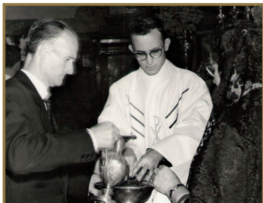
Lavatorio de las manos en la primera Misa, con sus padres.

de S. Pascual, cumpliéndose el deseo del Santo en aquel “pastoret que sempre havia volgut ser un bon xiquet!”