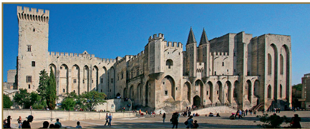
Catedral, Museo y Palacio Papal de Aviñón.

agua, donde desde 1226 se había establecido, a privilegiar real, una especial devoción por el Santísimo Sacramento.