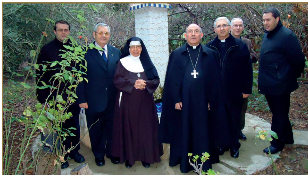
El Sr. Obispo, la Madre Abadesa, el Sr. Cura Párroco y otros sacerdotes en el huerto del Monasterio de San Pascual.

Rosario en su Convento y antigua Ermita está presente en la hoy Basílica de San Pascual.