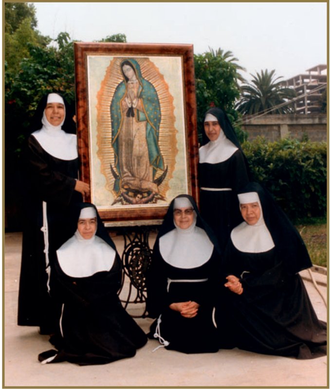
Las cinco hermanas mejicanas que hace 25 años, vinieron a la comunidad de San Pascual.

Han pasado ya 25 años y sigue la Comunidad en la brecha. Con las dificultades que origina el día a día un complejo tan importante como el Santuario de San Pascual, es decir, la Basílica, la Real Capilla con el sepulcro del Santo y el Monasterio de las religiosas clarisas. Realmente tiene su mérito el gobernar y mantener un recinto tan grande.