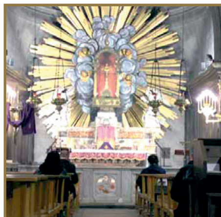
Capilla del Milagro Eucarístico de Aviñón.

Sobresalieron las intervenciones del P. Ramière, director general del Apostolado de la Oración, sobre la unión de las obras eucarísticas por medio de la devoción al Sagrado