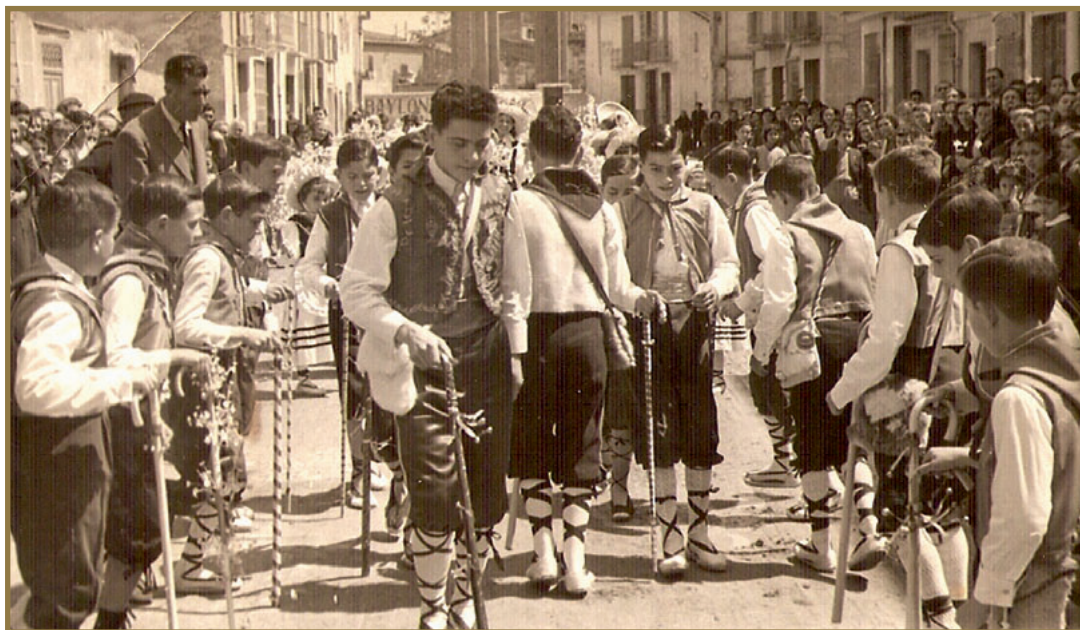
“Els Pastorets” de San Pascual en los años 50.

cos, tocados por el ejemplo de nuestro santo patrono, elevaron en sus primeros días sacerdotales la Sagrada Hostia, en el refectorio del convento donde el santo Lego ofreció su pan al ayuno para así dar de comer al hambriento y podemos decir con su ejemplo que “del pan que no comía sus pobres alimentaba”, ya que “su imán, vida y sustento era el Pan Vivo y Celestial”!