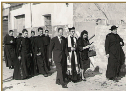
Camino de la Arciprestal para la primera Misa.

dispuesta la Celda de S. Pascual como devoto oratorio, entre las Obras que se realizaban en el Templo, aún muy atrasado y lejos de finales, que cobijase y mostrase a la veneración de los fieles los restos martirizados y calcinados del santo que se guardaban con gran veneración en la Arciprestal S. Jaime, se había decidido hacer su traslado con magnificencia.