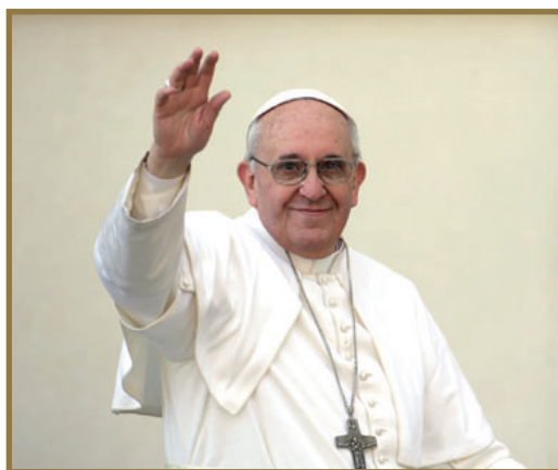
S.S. El Papa Francisco.

“La gloria de los mártires brilla sobre ti”. Estas palabras, que forman parte del lema de la VI Jornada de la Juventud Asiática, nos dan consuelo y fortaleza. Jóvenes de Asia, vosotros sois los herederos de un gran testimonio, de una preciosa confesión de fe en Cristo. Él es la luz del mundo, la luz de nuestras vidas. Los mártires de Corea y tantos otros incontables mártires de toda Asia, entregaron su cuerpo a sus perseguidores; a nosotros, en cambio, nos han entregado un testimonio perenne de que la luz de la verdad de Cristo disipa las tinieblas y el amor de Cristo triunfa glorioso. Con la certeza de su victoria sobre la muerte y de nuestra participación en ella, podemos asumir el reto de ser sus discípulos hoy, en nuestras circunstancias y en nuestro tiempo.