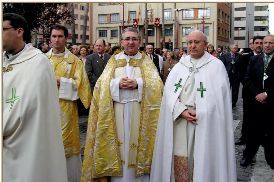
Procesión del Encuentro. Vila-real, 2005.