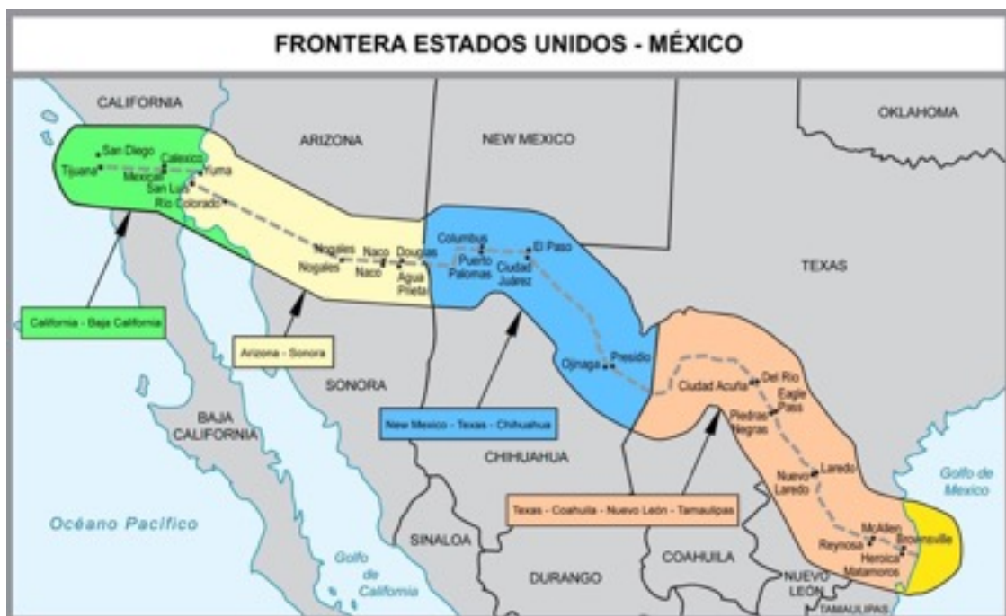
Ilustración 1 Mapa de las principales ciudades fronterizas [1]

La región fronteriza entre ambos países es una región vastísima que se prolonga aproximadamente a lo largo de 32 mil kilómetros, en ocasiones aprovechado por accidentes orográficos como el Río Grande y en otras simplemente con líneas rectas trazadas sobre el desierto heredadas de las guerras entre los Estados Unidos y México (como aprenden a ambos lados los escolares sobre el Tratado de Guadalupe Hidalgo, 1848) oficialmente llamado Tratado de Paz, Amistad, Límites y Arreglo Definitivo entre los Estados Unidos Mexicanos y los Estados Unidos de América, que dicho sea de paso luego son resaltadas por cercas de púas y muros. Esta frontera divide legalmente seis estados mexicanos de los cuatro estados meridionales estadounidenses, aunque socioeconómicamente la interdependencia económica, social y cultural que las ciudades fronterizas contiguas tienen entre ellas resulta un realismo contundente del existente entre ciudades de otras regiones en el mismo país.