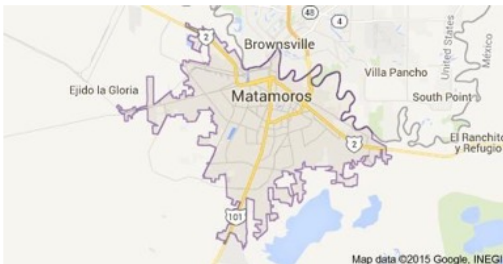
Ilustración 3 Área binacional Matamoros-Brownsville [3]

idea de que fuera una institución que pudiese arriesgarse con promotores para financiar proyectos y no a gobiernos. Al trabajar directamente con los acreditados aumentaban los riesgos pero se eliminaban los costes derivados de la intermediación de agentes financieros, motivo por el que los créditos se otorgaban a un menor coste que otras entidades multinacionales. Gracias a la existencia de financiamiento por proyectos muchos municipios y promotores privados asociados han podido llevar a cabo mejoras en los sistemas de alcantarillado, canalización y potabilización de aguas o la instalación de parques eólicos en el estado de Tamaulipas. No dejaré de recalcar sin embargo la enorme extensión de todos los territorios fronterizos, y la diversidad en el acceso a los servicios que experimentan los habitantes de cada uno de ellos; por este motivo, pasaré a concretar con mayor detalle el contexto particular de Heroica Matamoros, ciudad en la que se centra el presente proyecto.