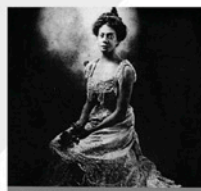
PRIMERO NACIONAL DE EDICIÓN UNIVERSITARIA MEJOR COLECCIÓN 2004