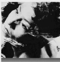
Suriel Nampashi FÁBULAS FEMINISTAS Introducción y traducción de Ana García Aragón