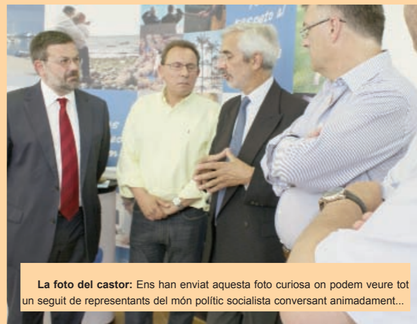
La foto del castor: Ens han enviat aquesta foto curiosa on podem veure tot un seguit de representants del món polític socialista conversant animadament...

Però com dèiem, l'anecdota, després de tant de temps, dóna per mes històries, com aquella que, gent que no ha posat mai un peu en un lloc de tanta cultura aparega a fer la visita, com si no res, fent-se la foto. O, gent, que sí n'entén molt de