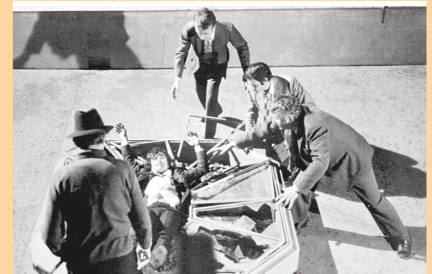
I altra vegada diuen que el Festival de Cinema de Peníscola perilla...

Per cert, pensen fer alguna cosa amb eixos banquets que hi ha al darrera de la caserna del Tourist Info que, en teoria, serveixen per descansar el cul i que ara, al faltar-los les barres, se té cola sense remei?