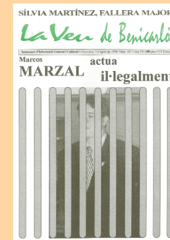
Portada La Veu del 7-08-1998 En el tema d'aquella setmana ja és feia ressò del maltracte al valencià

I és que actuacions contràries a l'esperit de la Llei d'Ús i Ensenyament del Valencià, en aquest poble, n'hem patit massa vegades per part dels governants del PP.