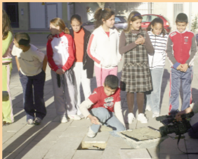
Alumnes de 5è, CP Mestre Francesc Catalàn. Benicarló