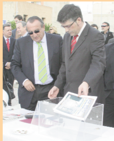
La Veu, la primera al forat del CSI

del CSI (Centre de Salut Integrat): la tercera pedra. Vinga, que ja hem entrat a la història. I a més, els primers. I de la ma del nostre "estimat" alcalde. Cal reconèixer que, tot i les diferències de criteris: "lo cortés, no quita lo valiente", que diria un altre castizo.