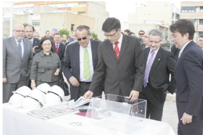
Ja veurem si Marcelino Domingo compleix la seua paraula...