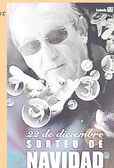
La imatge de la discòrdia

I aquesta altra no és menys bona, del nostre Presi de la Dipu en referència al fotomuntatge realitzat sobre un anunci de la loteria de Nadal on, la seua cara, substitueix la del famós calb de la sort, i que circulava per internet. Així, aquest, va assegurar que havia comprat una sèrie sencera del número que apareix al cartell, el 27,931, i que va dir "Me sacaré la pirula y mearé en la sede de Izquierda Unida si me