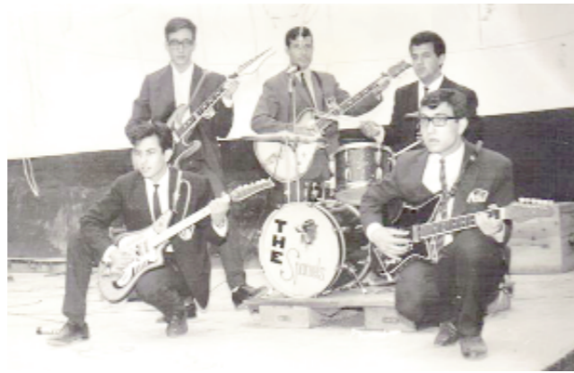
Abril de 1965: The Spaniels debuten al Cine Rex