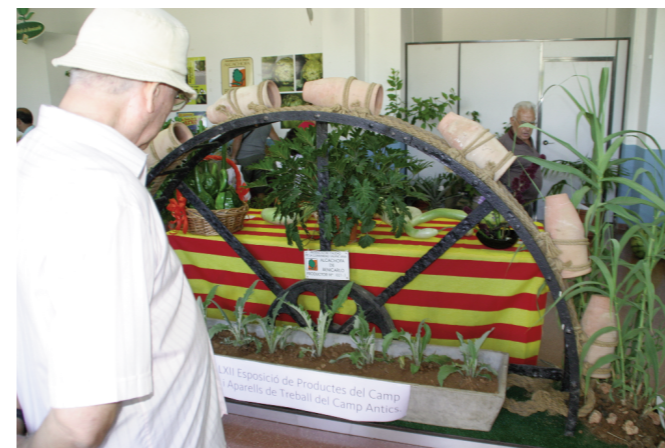
Productes del camp