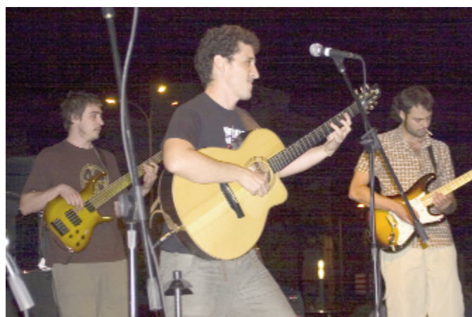
Pepet i Marieta... o com diria Cuenca: "La excepció confirma la regla"