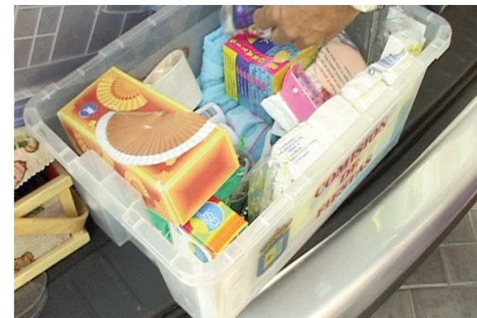
Al cotxe oficial porten de tot