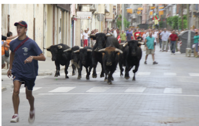
La foto de la dreta es del dimecres 29: Després de les festes cal llevar els obstacles del carrer!!!!