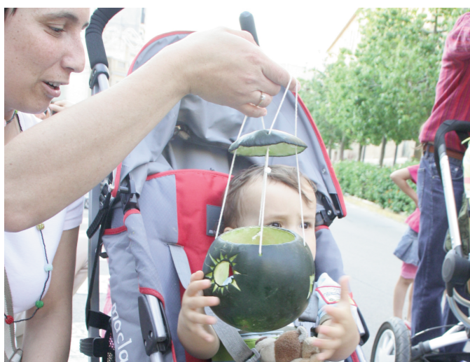
El melonet de moro es tradició amb futur