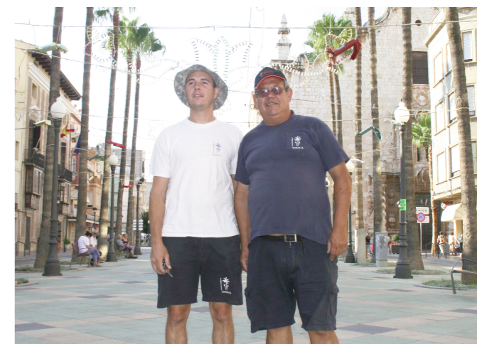
Pirotecnia tomàs amb lo masquet a la mà