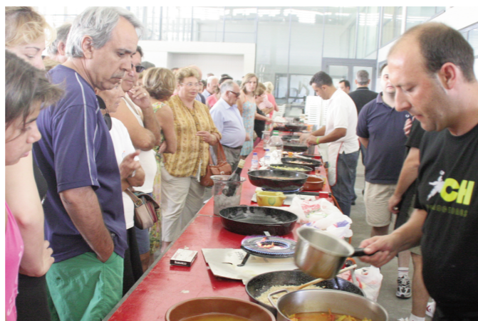
Mel! (sense embolics)