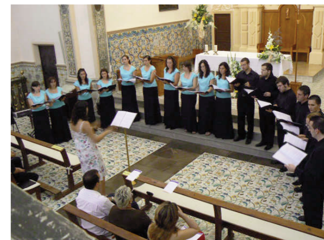
Al Santuari de la Misericòrdia