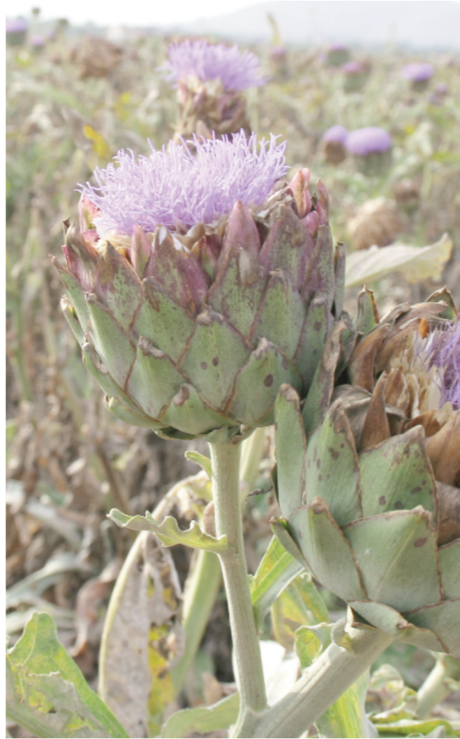
Ara les estagues