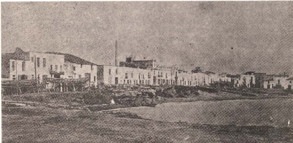
La Plaza del Santísimo, en 1908.

¡CONTEM AMB L'ASSISTENCIA TOTAL D'AQUELLS QUE ESTIGUIN IDENTIFICATS AMB NOSALTRES!