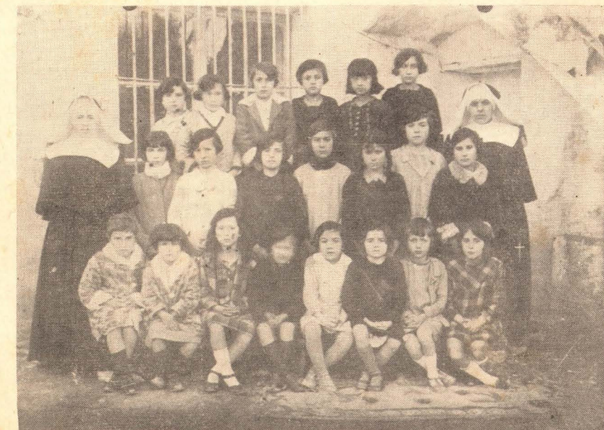
Fotografía de 1926, tomada en el Colegio de la Consolación de Vinaroz.

A los pocos días de la venida de las Hermanas (9 de mayo), el Ayuntamiento acordó se oficiara al Sr. Obispo dándole las gracias por su comportamiento: