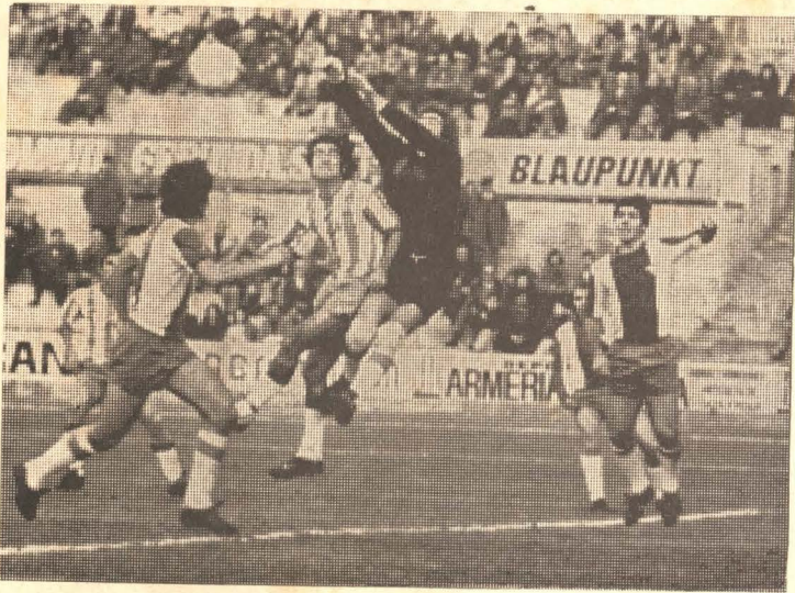
2-XII-76, en el Montlleví, 3-0. Mañana el Vinaroz C. de F., catapultado por su ferviente hinchada, hará lo indecible por conseguir la revancha.

El Gerona C. de F. se fundó el 25 de julio de 1927. Militó varias temporadas en Segunda División y lleva dieciocho en la actual, habiendo jugado distintas promociones sin éxito. Con el Vinaroz C. de F. ha competido en nueve oportunidades. El cuadro rojiblanco venció en cuatro partidos (1-0, 2-0, 2-0 y 3-0). El Vinaroz saboreó el triunfo en tres (2-0, 2-0 y 2-0) y dos igualadas (1-1, 1-1). El tanteo más abultado se consiguió en este ejercicio, el 12 de diciembre. Nuestra cobertura dio facilidades y Abad, Abete y Javi desmantelaron al Vinaroz C. de F. (3-0).