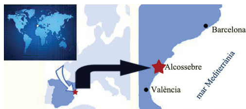
FIGURA 1. Localització de la població de Xerosecta explanata trobada a un àrea dunar costanera al terme d'Alcossebre.

Finalment a l'octubre de 2011 es va localitzar una zona amb exemplars vius d'aquesta espècie a Alcossebre, a 1,5 Km al sud d'on es va trobar la primera closca. La població es localitza dins d'una àrea d'uns 13.000 m 2 limitada per un camí asfaltat, construccions residencials i parcel·les de cultius abandonats. Les construccions divideixen l'àrea ocupada en dues zones, sent més escassa la presència de X. explanata a la zona més meridional on existeixen abocaments de residus inerts i restes de jardineria, que potser han causat la introducció d'una flora invasora. A l'altra zona, la més septentrional, l'espècie és molt més abundant: s'arriben a comptabilitzar 16 exemplars vius per m 2 als punts de major densitat.