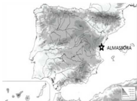
FIGURA 1: Mapa de situació d'Almassora a la península Ibèrica.