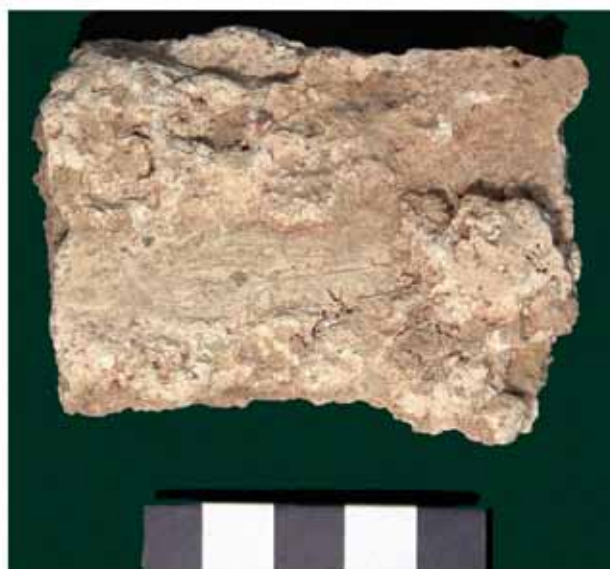
Lámina 36.-Restos de material de construcción con enlucidos pintados, barro y encañizados.