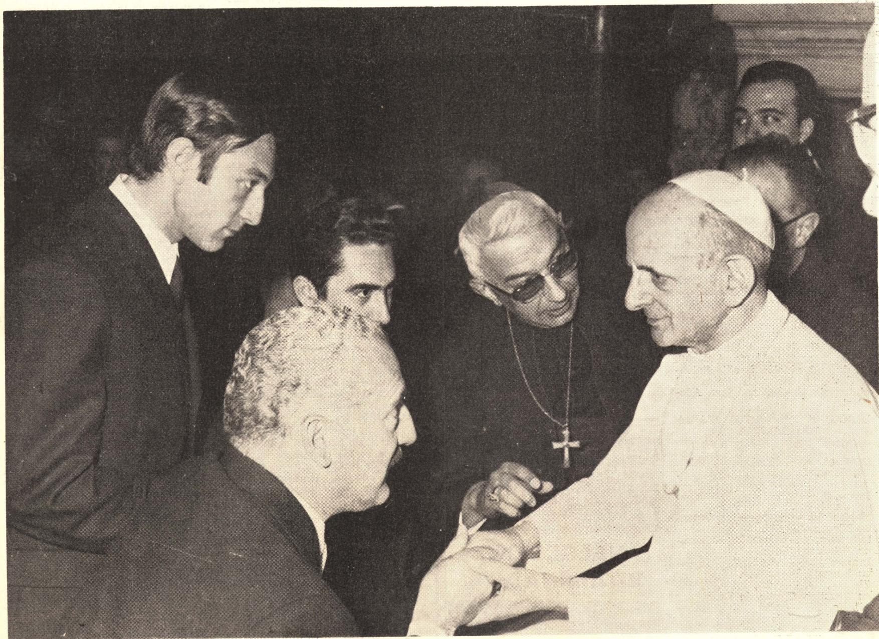
Emocionante momento en que el Cardenal Primado presenta a S. S. el Papa a nuestro Alcalde, al que posteriormente impartiría Su Santidad su especial bendición para todo el pueblo de Vinaroz.

Extraordinario entusiasmo y enorme ilusión en la ciudad, ante la anunciada visita de su antiguo Arcipreste, actual Cardenal Primado de las Españas, VICENTE ENRIQUE Y TARANCON Que llegará pasado mañana, a las 9'30 de la mañana