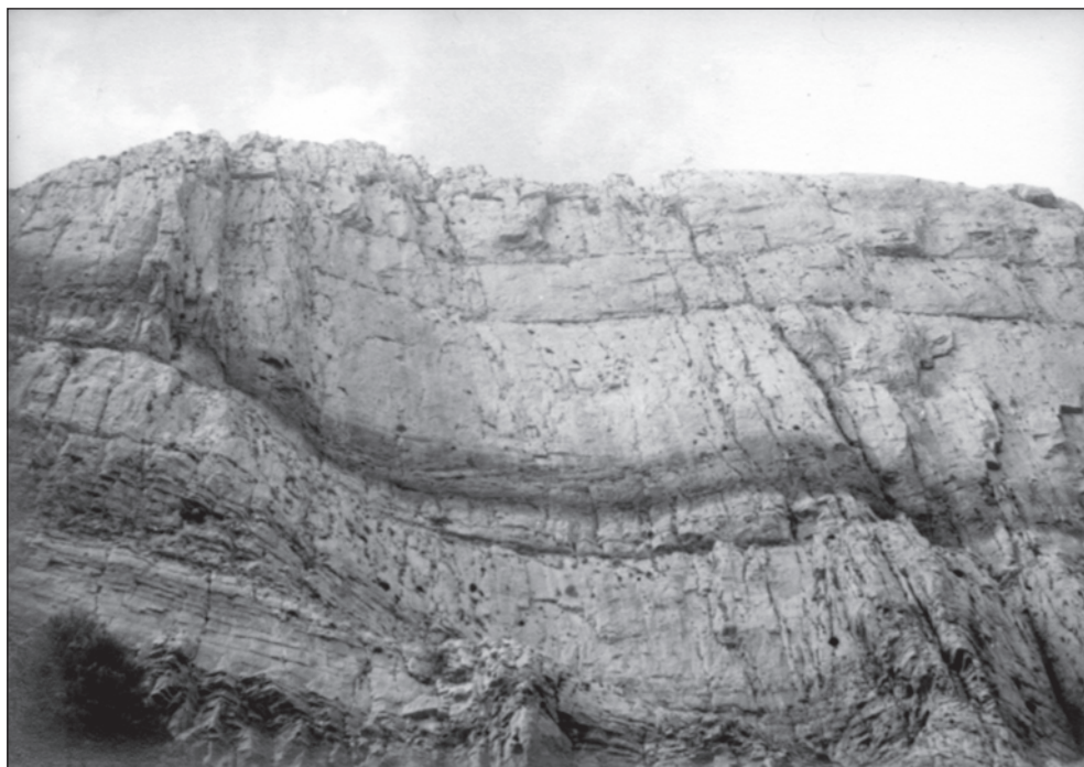
Penya-segat de Penyagolosa

col·laborarà en l'escalada amb la presa de notes i si hi ha algun problema buscarà ajuda.