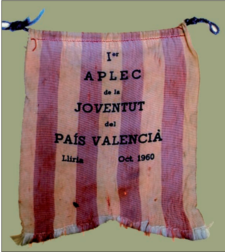
Senyera de l'escalada

peu de la paret, en una caiguda sense tocar roca, ja que la via es desvia a poc a poc a l'esquerra i tens tot un buit respectable més avall teu.