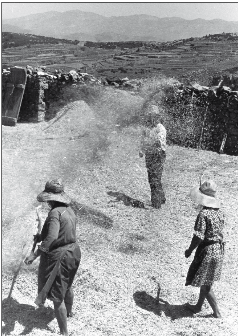
Ventant la batuda.

de cànter, es pot fer servir amb la mateixa funció una albarca, una sabata vella, un pot, etc.