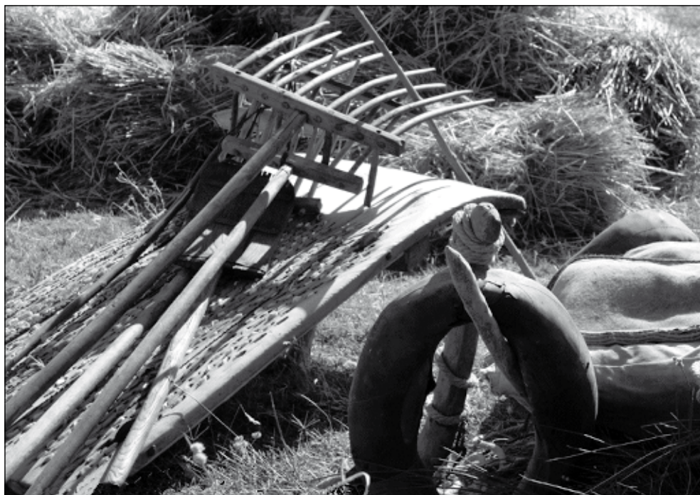
Ferramentes per trillar

Com hem dit, en ocasions, el trill pot ser arrossegat per un sol matxo, però si s'enganchen dos animals s'anomena conlloga de dos , 5 si van estirant tres matxos amb colla de tres i si en són quatre amb colla de quatre . Tanmateix, una colla de tres o més animals, de vegades, pot arrossegar alhora dos trills. I encara, per últim, en alguns masos que tenien molts dies de trilla, per ser més eficients i avançar més en la feina solien trillar dues colles de matxos alhora però independentment l'una de l'altra.