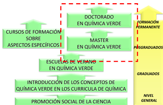
Figura 1. Principales actividades formativas en Química Verde consideradas por la REDQS.

La creación y mantenimiento de un programa integrado y cooperativo de formación de posgrado en Química Sostenible ha sido un proceso complejo. Por un lado, la necesidad de interaccionar con distintas instituciones académicas que, en España, poseen un grado de autonomía muy elevado y que, por lo tanto, pueden poseer regulaciones y políticas educativas diferenciadas. Por otro lado, puesto que en el modelo legal español la autorización de titulaciones es una competencia atribuida a las Comunidades Autónomas (gobiernos regionales) ha sido necesario obtener las autorizaciones correspondientes mediante procesos que en algunos casos presentaban variaciones importantes. Este proceso de autorización ha requerido, además, la aprobación de la titulación correspondiente por un organismo de evaluación antes de su aprobación definitiva por el Estado Español. Finalmente, todo este proceso se ha tenido que realizar en el