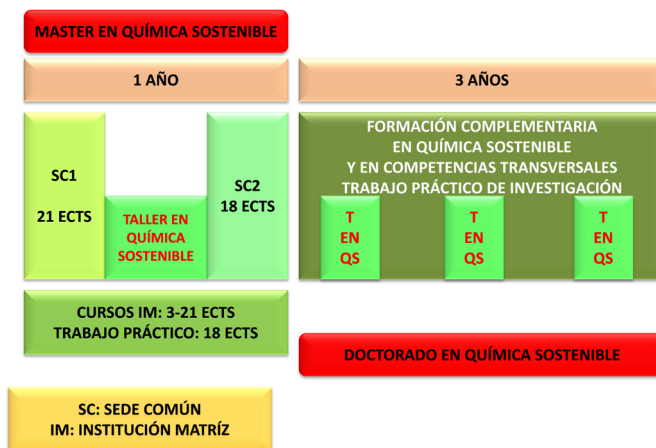
Figura 4. Organización académica del Máster y del Doctorado Interuniversitario en Química Sostenible.

Siempre que las circunstancias económicas lo permitan, la Comisión Académica gestiona el que entre los dos periodos de docencia común se realice un Taller de Química Sostenible con la participación de expertos de distintos países que imparten un número reducido de sesiones (no más de tres) durante dos días consecutivos y están disponibles para realizar consultas y un trabajo más práctico con los estudiantes durante los días próximos al evento. Este taller varía cada año, lo que permite que pueda ser seguido, como una herramienta formativa fundamental por los estudiantes de doctorado durante los tres años siguientes al Máster.