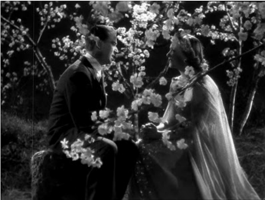
Eloísa está debajo de un almendro , Rafael Gil, 1943

En fin, de eso se trata: de que, con este libro, su autor ha conquistado un espacio propio en la discusión científica en torno al cine español. Han sido precisas por su parte grandes dosis de vocación, de generosidad y de perseverancia para entregar un recuento histórico, ya que no general, al menos sí completo, como éste; y que no quita , sino que suma , en la medida que añade (en lo neto), matiza o enmienda (en lo impreciso u opinable), a las restantes obras de referencia. Tanto el empeño como sus logros merecen nuestro encomio. Y esto no es equidistancia ni relativismo, sino pura y simple honestidad.