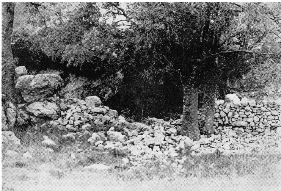
Vista general de la entrada de la cavidad.

La cavidad se ubica en la vertiente sur de la montaña, que formando espolón, se introduce entre el Barranco dels Cirerals y el Barranco Molero, los cuales confluyen hacia el Barranco de la Gasulla, en cuyos farallones se encuentran los conocidos abrigos con pinturas rupestres del Cingle de la Gasulla y Cova Remigia 1 que distan de la cavidad aproximadamente 1 Km. en línea recta.