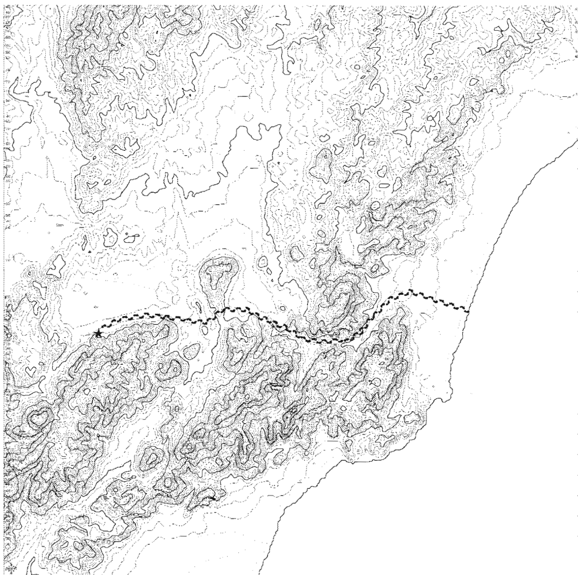
Figura 3. Recorrido de tres horas de camino entre el yacimiento y el litoral.

Tossal; probablemente este tipo de paisaje abierto se interrumpía con algún bosque de pino y enebros, según los primeros resultados botánicos de que disponemos. Hemos de tener en cuenta que ambas especies se reproducen entre febrero-marzo a septiembre para la liebre, y entre marzo a septiembre para el conejo. Este último, intensamente explotado para la alimentación en las dos fases más antiguas del asentamiento, sitúa a este grupo magdaleniense como cazadores expertos en la captura dicho lagomorfo. El tamaño del animal y la escasa biomasa que presenta, contribuyó a intensificar su cacería con el fin de abastecer suficientemente la alimentación del grupo. A un mismo tiempo, la naturaleza de estos caracteres no requiere una movilización de un colectivo de cazadores, sino que probablemente su apresamiento se haría individualizado, y posiblemente mediante el uso de trampas. Dado pues, que el conejo es una especie que prefiere tanto los bosques, calveros, como las espesuras, no podemos descartar la existencia de zonas de bosque o de matorral espeso; la liebre aunque prefiere un biotopo de espacio abierto también se adapta al bosque.