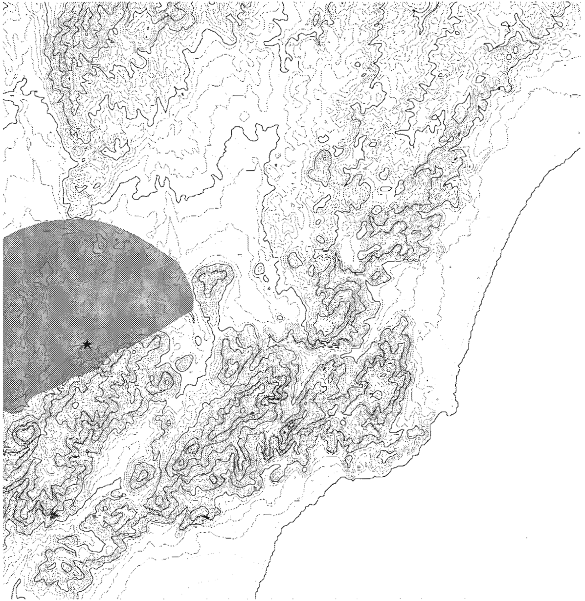
Figura 1. Mapa que muestra el recorrido de una hora de camino desde el yacimiento, señalado con una estrella.

Tossal; una de ellas, la denominada Cova del Tossal de la Font fue excavada por F. Gusi, a mediados de los años ochenta, descubriendo un húmero y un coxal perteneciente a un individuo de la especie Homo sapiens neanderthalensis , así como algunas industrias musterienses, en un colada brechoide. En esta misma cavidad, y en el interior de los corredores y simas kársticas se hallaron restos de enterramientos pertenecientes al bronce medio, existiendo algunas evidencias de hábitat de este periodo, en la propia sala de la cavidad.