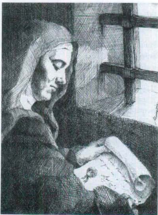
Santa Clara. Cubierta del libro Florecillas de Santa Clara.