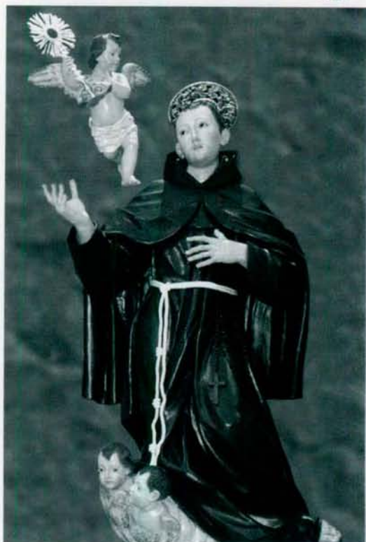
Imagen de San Pascual venerada en el Convento de San Francisco de Biancavilla Sicilia (Italia).

Catalina Ramírez, vecina de Villarreal, padeció un humor tan maligno en los pechos, que de él se le ocasionó una penosa llaga. No hallando medicina que la curase