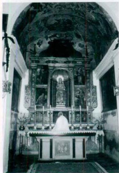
Capilla principal dedicada a Santa Ana

En la Iglesia, tienen un pequeño altar con una imagen de San Pascual, del escultor valen-