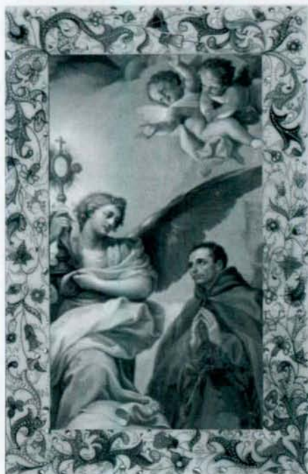
Pintura de San Pascual en la Capilla de San Pedro de Alcántara. Arenas de San Pedro. Ávila. Óleo de Mengs.

Fray Juan marchó a su celda e hizo como le había aconsejado el Santo. El efecto fue inmediato: cesó el dolor de muelas de repente.”