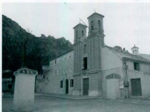
Fachada del Monasterio de santa Ana del Monte.

una pequeña reja y un Cristo Crucificado, denominado el Cristo de la Reja del Siglo XVII, al que la población de Jumilla le profesa una gran devoción.