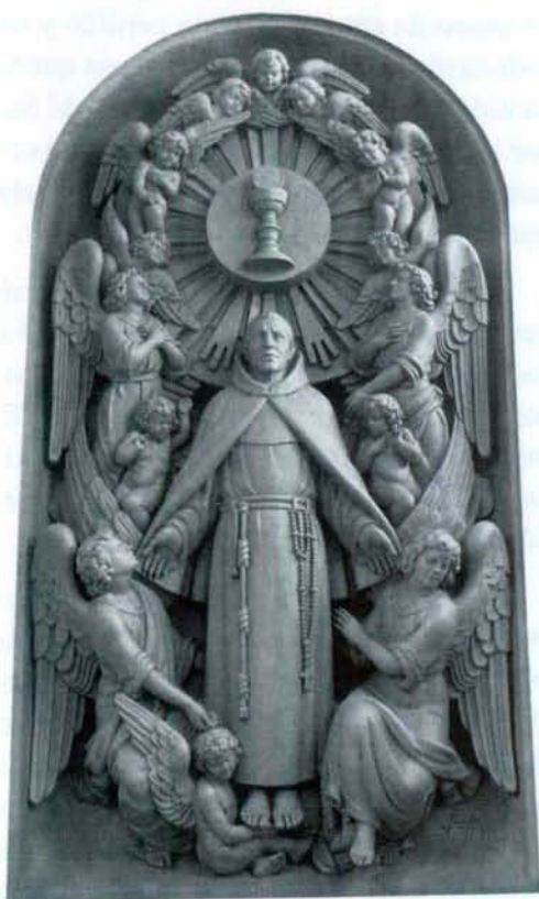
San Pascual en el retablo mayor de la Basílica.

Con la palabra "Pascua", indicando la Navidad, nos adentramos un poquito más en el mismo misterio de Dios. ¿Qué significa "Pascua", sino "el paso de Dios hacia los hombres y el paso de los hombres hacia