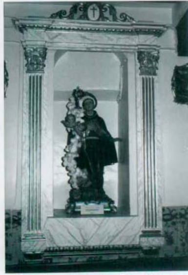
Hornacia con la imagen de San Pascual.