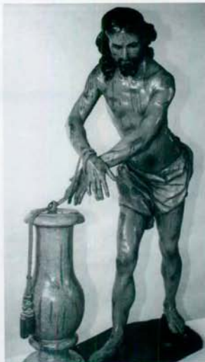
Imagen del Cristo de la Columna.