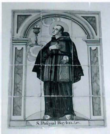
Panel cerámico dedicado a San Pascual.

Del Beato Andrés Hibernón, tienen una talla de Roque López de 1792, existe en el segundo piso su celda, también hay un mosaico cerámico dedicado a él.