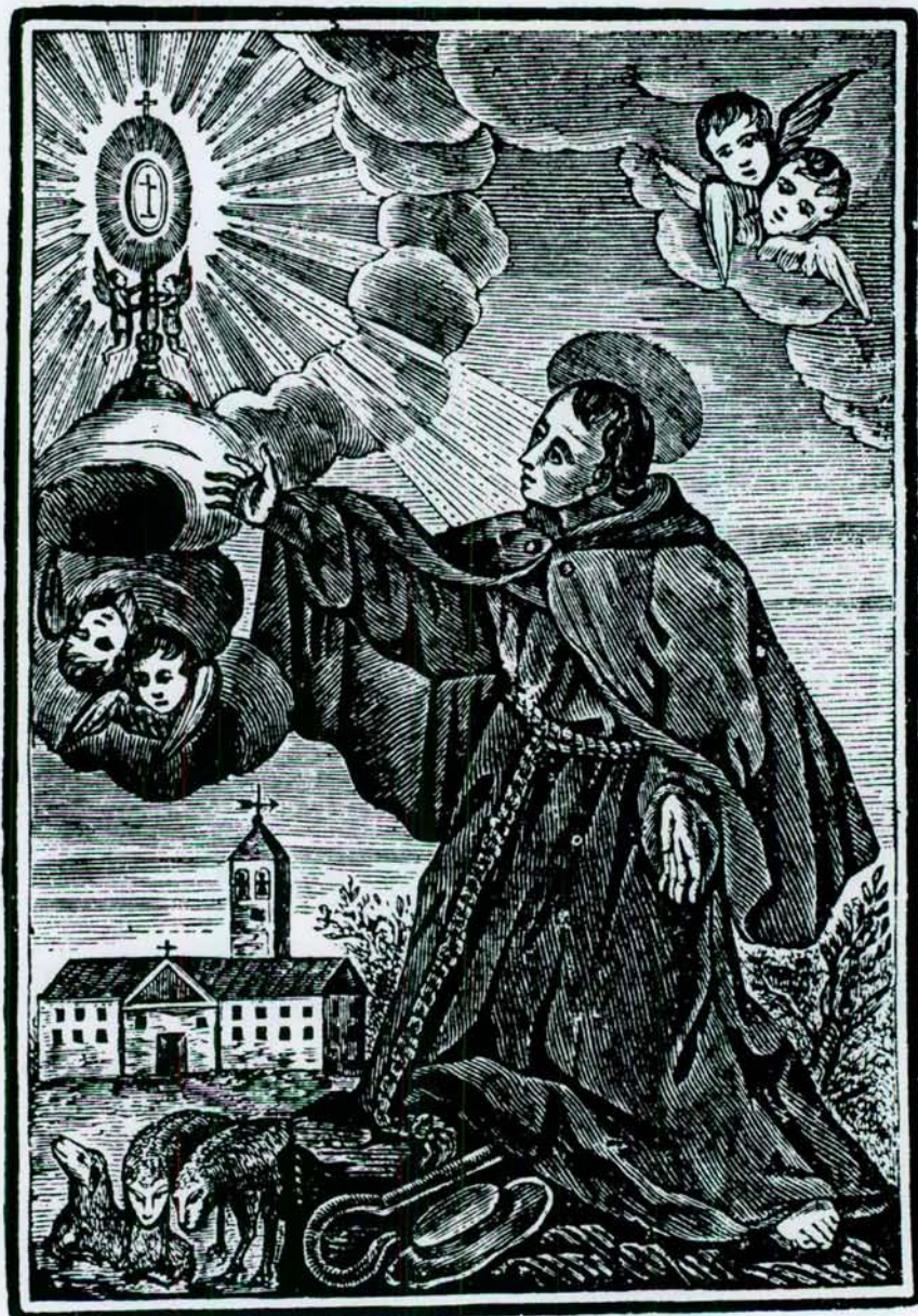
San Pascual Bailon.