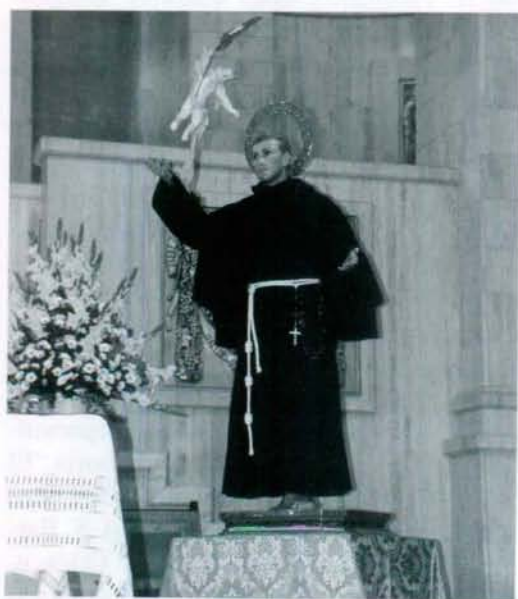
Imagen Procesional de san Pascual.

Así el gozo y la alegría de la Navidad se ven en cada letra que escribe S. Pascual a lo largo de los siete Opúsculos que le dedica. Como los niños, que por las calles entonan sus "Albaes" en la Nochebuena, como la