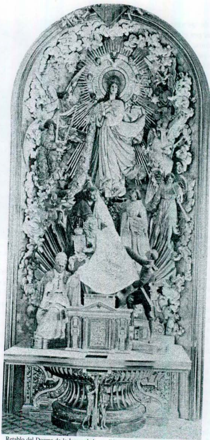
Retablo del Dogma de la Inmaculada, posiblemente la mejor obra del escultor Pascual Amorós. Ubicado en la iglesia de las Monjas Josefinas fue destruido en la guerra civil de 1936.