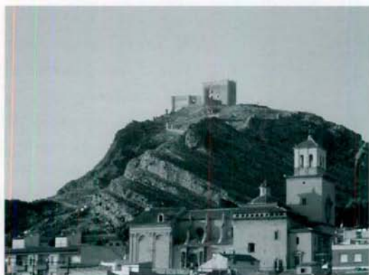
Vista del Castillo de Jumilla y la Iglesia de Santiago.