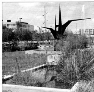
Dentro del ámbito educativo se genera presión en la vida de las generaciones futuras. Estamos en un período de crisis ambiental.

Es un proceso abierto y selectivo voluntariamente por los docentes, se trata, precisa de una implicación emocional, aunque también es necesaria una implicación intelectual.