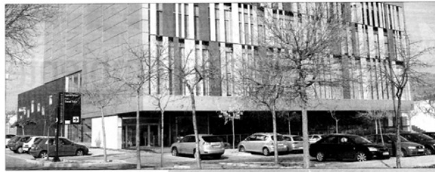
La Universitat Jaume I concede una gran importància a la preservació de nostre entorn. La Oficina Verda se creà com a projecte mediambiental de la UIJ dins d'un compromís declarat en la Junta de Govern de 1996.