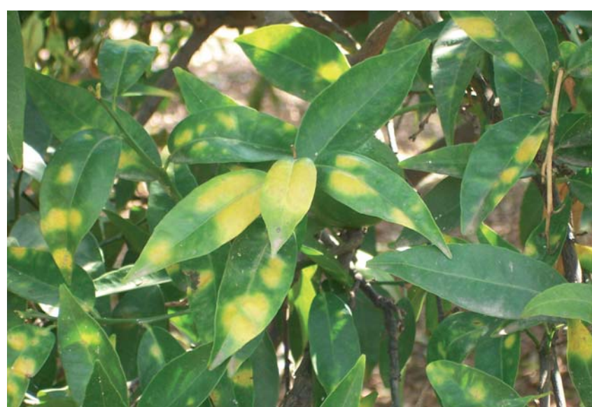
Figura 1. Manchas en las hojas de clementinos producidas por la araña roja.