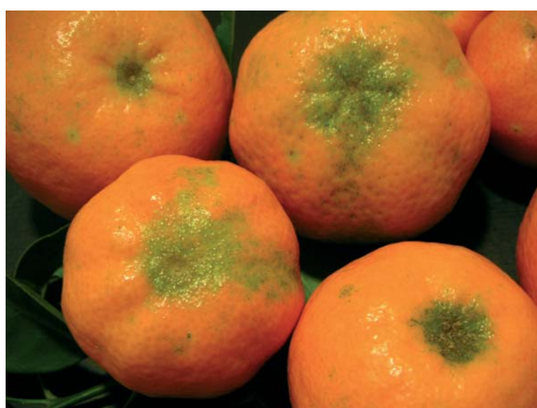
Figura 2. Manchas en los frutos de clementinos producidas por la araña roja.

do excluidos del Anexo 1 de la Directiva 91/414 CEE, que contiene la lista de las sustancias activas permitidas para el control de plagas en la Unión Europea.