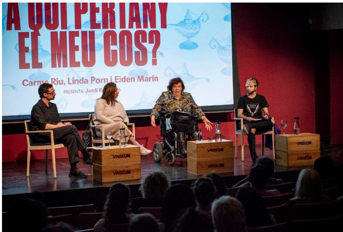
Debat VilaPensa 2022. A qui pertany el meu cos?

iconografia del geni francès Toulouse-Lautrec, amb disseny dels artistes locals Pau Boada i Lluís M. Güell, escenografia dels germans Albornà i figures dels germans Castells; el mural satíric Tres aigües són perdudes (1915), de Xavier Nogués (fragment que formà part del conjunt de mural de les Galeries Layetanes, dipòsit de la col·lecció del MNAC); dos quadres d'artistes de la segona avantguarda catalana com Copa i raïm (1993), d'Albert Ràfols-Casamada, El cep esclata silencis (2007), de Josep Guinovart, o la instal·lació Som un sol cos (2012), de l'artista contemporània Eulàlia Valldosera, una peça que prové de la Col·lecció Nacional d'Art Contemporani, dipositada al fons de VINSEUM des de 2019 i que ara mateix és l'obra més contemporània de la col·lecció. Una petita tria, a tall d'exemple, que en la nova exposició ha de veure's ampliada amb altres