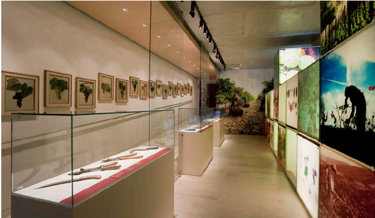
Exposició permanent. Espai Tirs.

enciclopedista de l'exposició, un museu de petits museus, amb espais bigarrats, parapetats amb un deversall aclaparador d'objectes dels diversos fons heterogenis escampats per unes sales que arriben a finals del segle xx ja envellides. Així, als anys 80 entren al museu les primeres promocions de la universitat democràtica, que conviuen amb els diferents caps de secció, directors d'un museu atomitzat pels camps del coneixement que marquen la naturalesa dels fons que guarda. Aquesta nova fornada jove i universitària, principalment arqueòlegs que treballen amb els fons que arriben dels jaciments que s'excaven al Penedès, aporten la primera mirada crítica i rigorosa, que acabarà desembocant amb un debat intern per a la renovació de la institució a partir del canvi generacional de manera progressiva, a poc a poc. L'arribada dels 90 porta sota el braç la publicació de la primera Llei de Patrimoni aprovada pel govern democràtic català. La