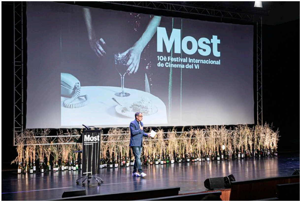
Gala de la inauguració del MOST 2021.

tral de la festa... i és així com a la taverna les converses s'obren i tant poden parlar-hi sommeliers, com poetes, historiadors, científics, clients, elaboradors, visitants, gastrònoms, passavolants, viticultors... Segurament aquests fils de conversa i reflexió són els que fan el vi tan atractiu.