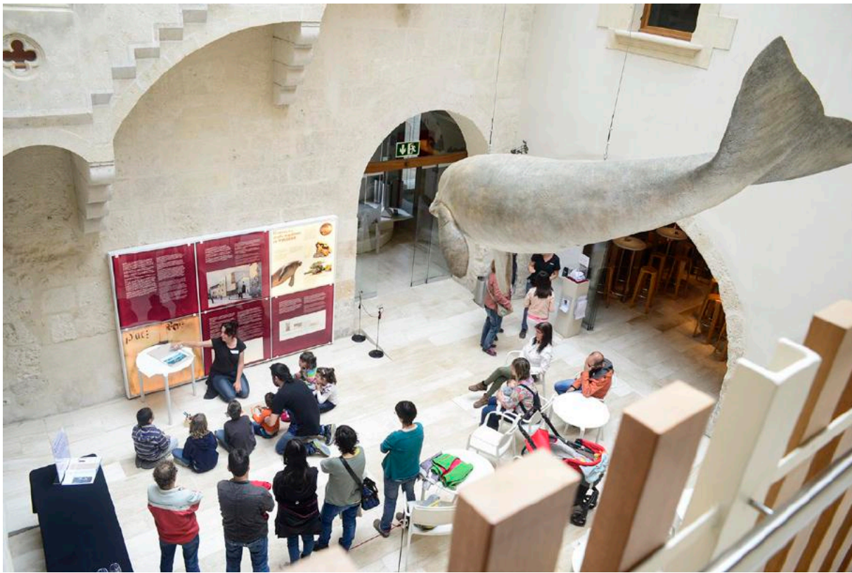
Activitat educativa al pati de VINSEUM. DIM 2019.

al fons del museu també sobresurt la mostra «Jo, Joan. Capítol 3» (2016), dedicada a mostrar les investigacions fetes i promogudes des del Museu Nacional d'Art de Catalunya sobre una talla romànica de Sant Joan Evangelista provinent de la col·lecció Manuel Trens i que demostra com una sola peça pot permetre una multiplicitat d'aproximacions i recerques amb col·laboració d'altres institucions.