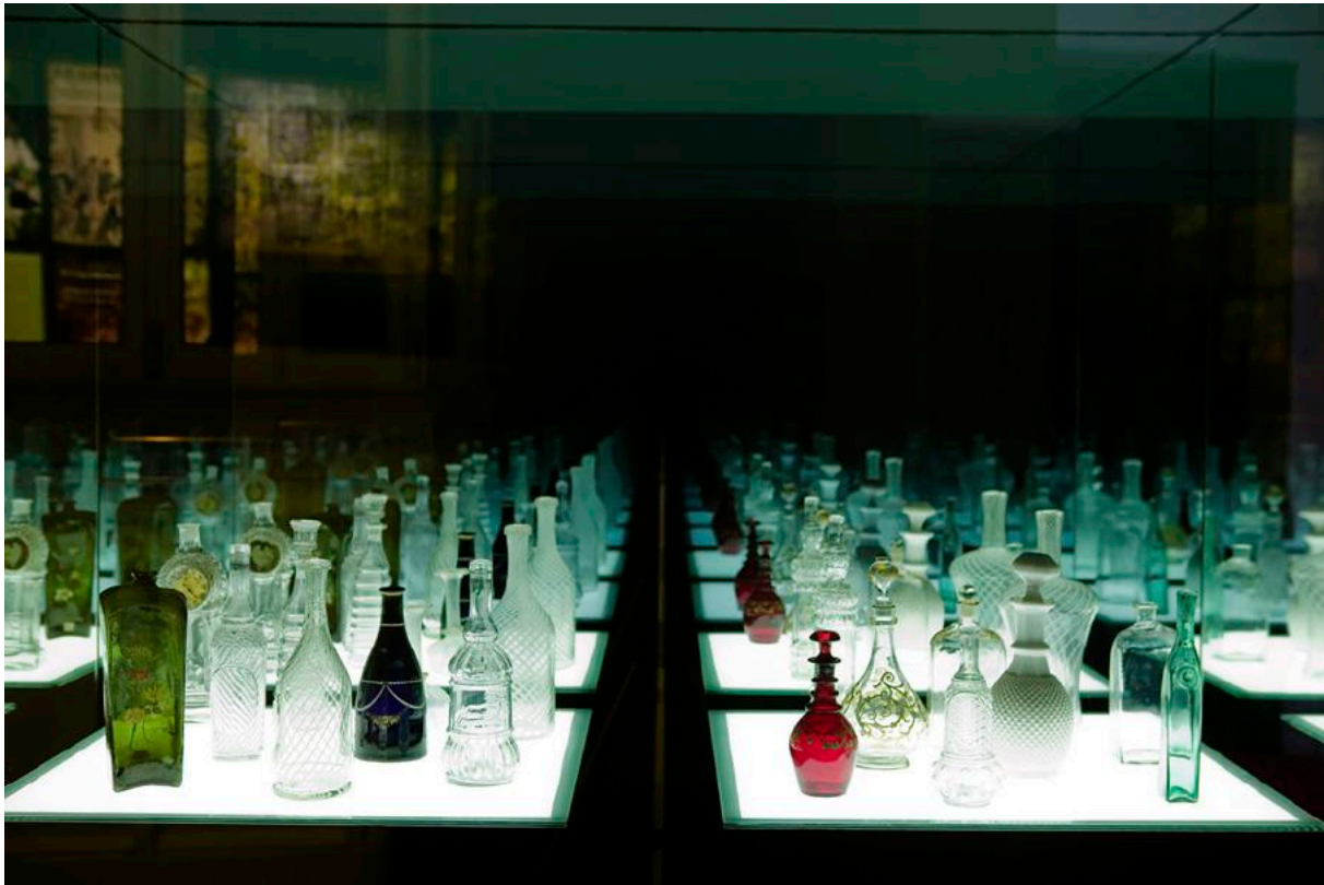
Vitrina espai Sobretaules.

la sommelieria. El conjunt fa que cada edició sigui una oportunitat també per als professionals del sector, així com també pels winelovers i pels amants del cinema.