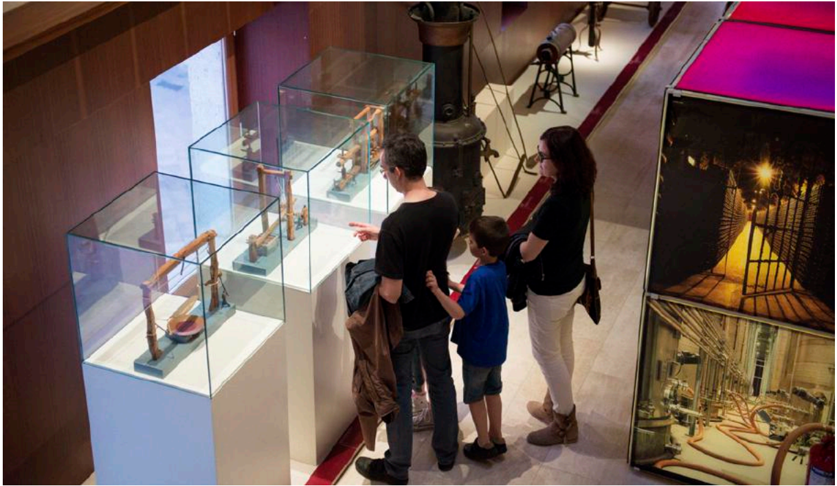
Exposició permanent. Espai Clos.