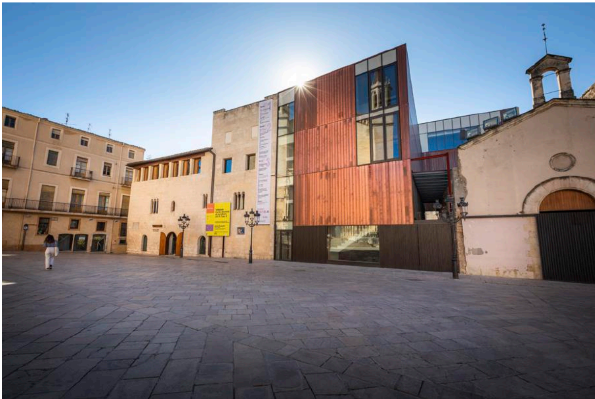
Façana del nou VINSEUM.

des de 2010 les naus de Cal Berger, magatzem de vi centenari a cavall entre el modernisme tardà i el noucentisme, passa a ser l'espai d'operacions del revers de VINSEUM, adaptant-se i reordenant els seus espais de classificació i de laboratori de restauració.