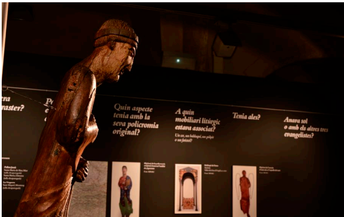
Detall exposició «Jo, Joan. Capítol 3» (2016).