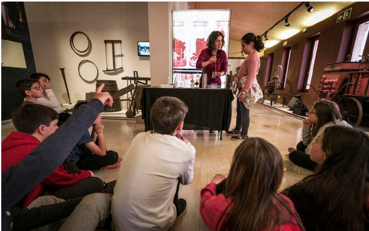
Activitat educatiu a l'exposició permanent.