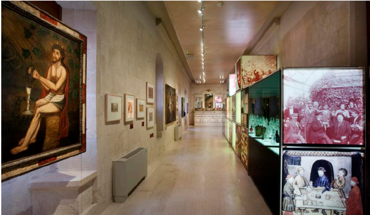
Exposició permanent, Espai Sobretaula.

com és l'antic palau del rei Pere el Gran, que serà el cor de totes les transformacions que viurà el museu durant aquests més de 85 anys.