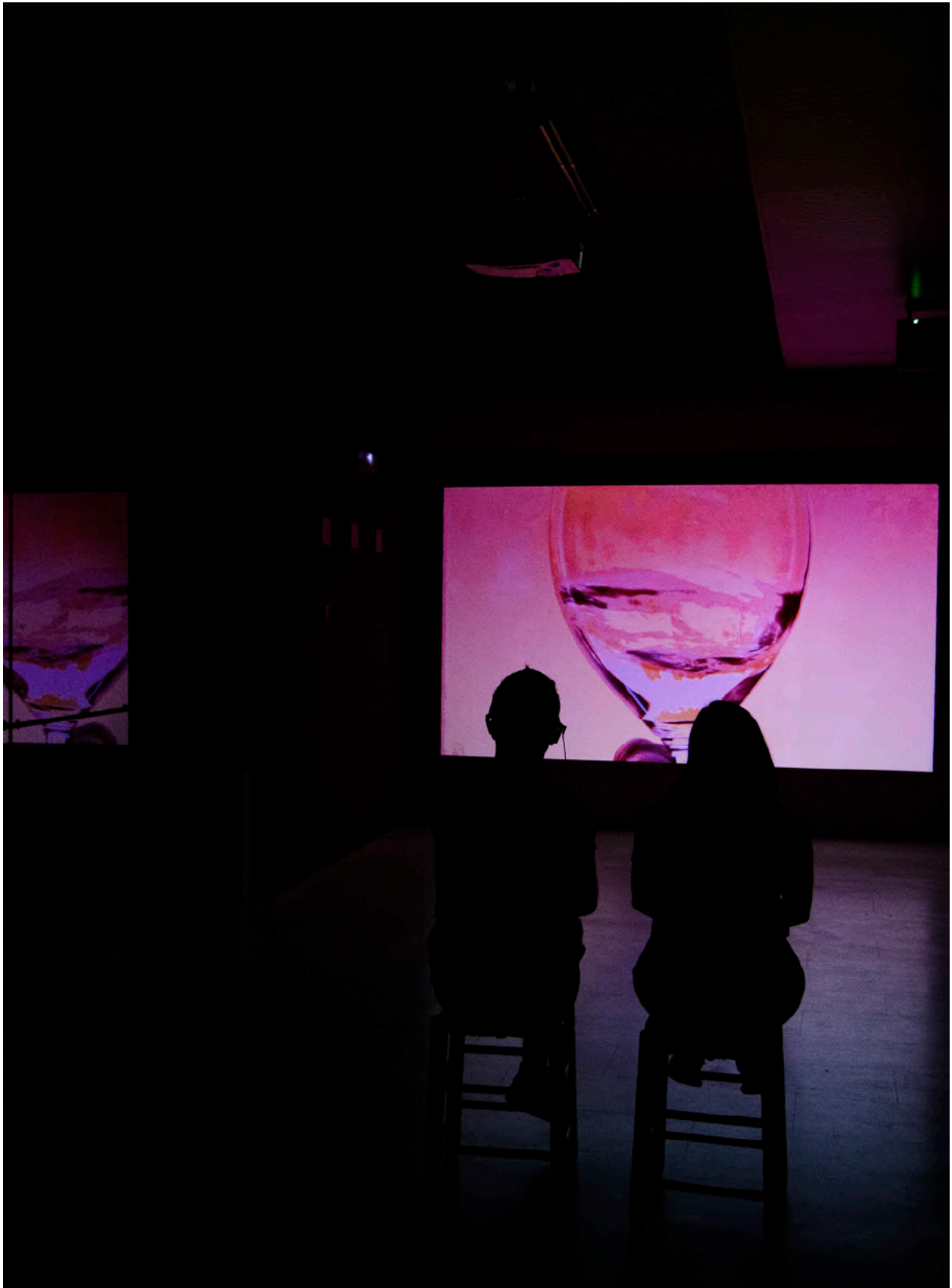
Exposició permanent. Espai Rebot.