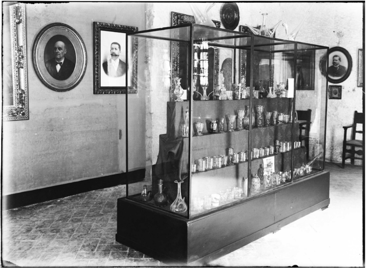
Sala del museu anys 40.

la Diputació de Barcelona, que aporta un 25% del pressupost amb finançament europeu.