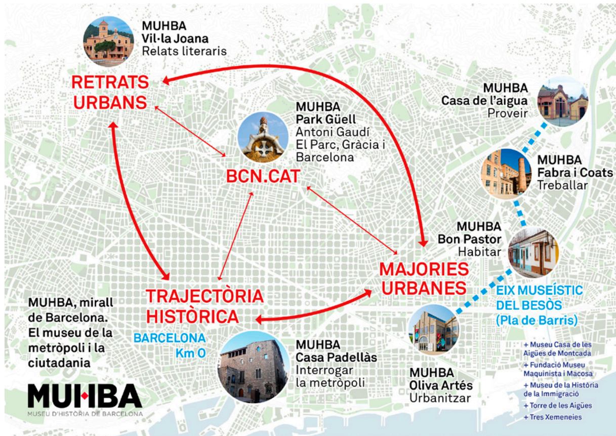
Visió estratègica de les relacions entre museu i ciutat, amb els espais vinculats al MUHBA, 2018. Cartografia d'Andrea Manenti.

En el cas de Barcelona, els temps de creixement sense democràcia sota la dictadura franquista van crear un entorn socialment ampli per a la reflexió crítica sobre la ciutat. Entre 1976 i 1995, en les primeres dècades de la democràcia recuperada, Barcelona va experimentar una gran renovació als barris impulsada per les reivindicacions ciutadanes, combinada amb les grans infraestructures urbanes propiciades pels Jocs Olímpics de 1992. La ciutat aconseguí un gran prestigi internacional per les actuacions a l'espai públic i als equipaments culturals dels barris: biblioteques, centres cívics o escoles musicals, entre altres. Fou una primera transició cultural, que va anar acompanyada totalment o parcialment de l'equipament en altres àmbits dependents del govern català, com escoles, instituts i centres assistencials. En aquells moments,