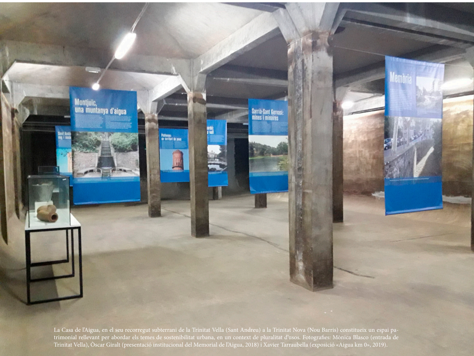
La Casa de l'Aigua, en el seu recorregut subterrani de la Trinitat Vella (Sant Andreu) a la Trinitat Nova (Nou Barris) constitueix un espai patrimonial rellevant per abordar els temes de sostenibilitat urbana, en un context de pluralitat d'usos.