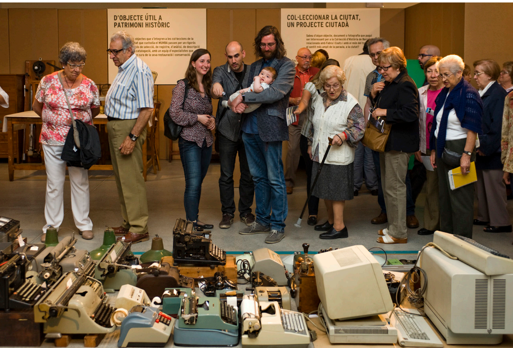
Obertura de l'exposició «Fabra i Coats fa museu» (maig de 2014), organitzada pel MUHBA (Museu d'Història de Barcelona) en col·laboració amb els Amics de la Fabra i Coats, altres entitats i el Districte de Sant Andreu, en el marc del projecte de l'espai museístic sobre la ciutat del treball.