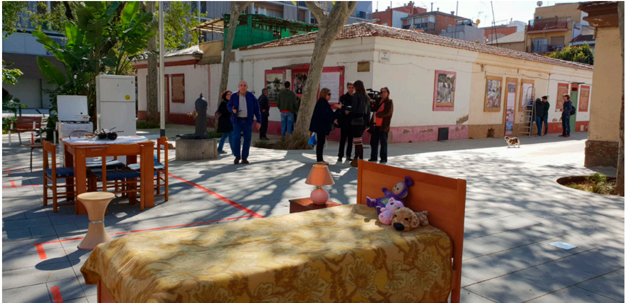
El 30 de març de 2019 el MUHBA, les entitats i els veïns i veïnes del Bon Pastor van muntar el Museu al carrer, a la manera del film Dogville de Lars von Trier. El projecte museístic de les Cases Barates, «Dogville Virtual» inclòs, es presentarà al proper congrés de l'Associació Europea d'Història Urbana a Anvers.

del barri i preservar les memòries compartides, que ha ajudat a la recuperació i recollida de materials i béns mobles d'alguns dels habitatges.