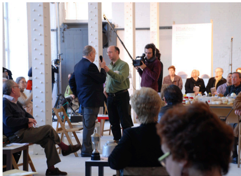
Fabra i Coats: la Nau F, futur espai museístic, la Sala de Calderes, i la representació de Relats de Fàbrica pels antics treballadors de l'Associació d'Amics de Fabra i Coats, el 19 de març de 2011.