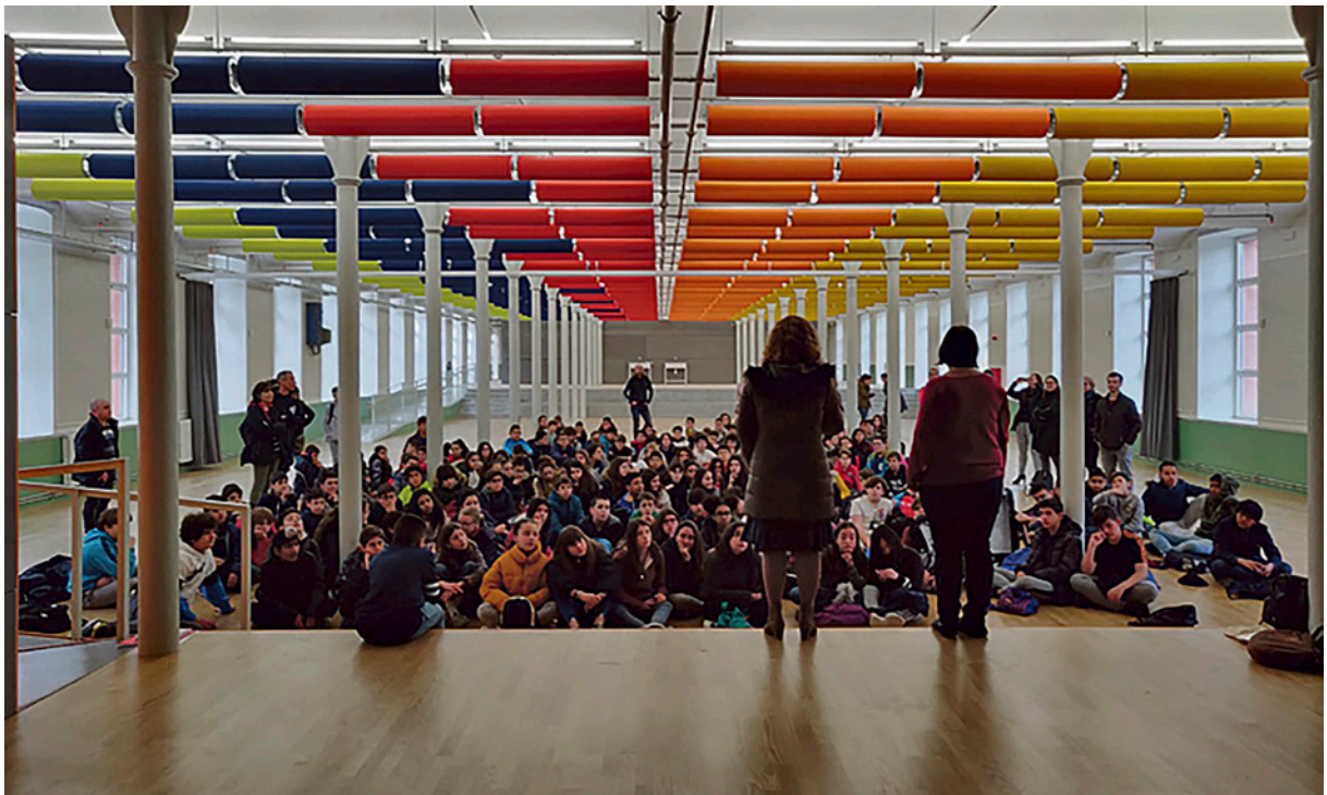
La sala d'actes de l'Institut Martí i Pous manté el ritme de les columnes com a pauta estructuradora del conjunt de l'espai, junt amb altres elements del passat industrial de l'edifici. Barcelona viu en l'actualitat un clima de debat estimulant sobre les modalitats d'intervenció en el patrimoni industrial, que té un lloc de privilegi en les actuacions successives al recinte de la Fabra i Coats.

La visió metropolitana de l'Eix patrimonial Besòs permet idear-lo com un vector cultural intermunicipal.