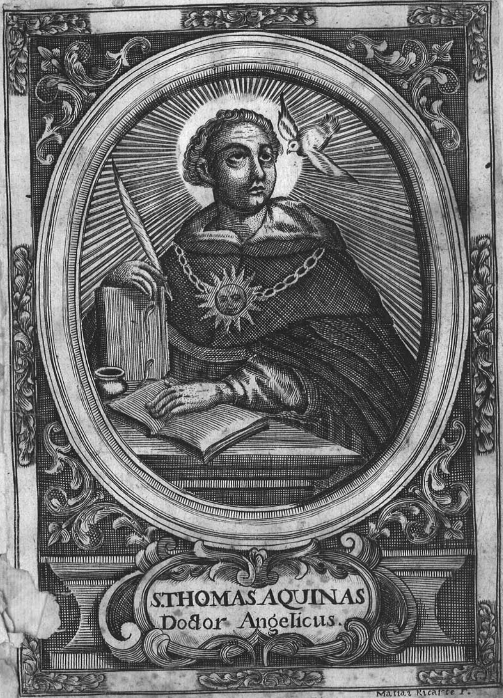
STHOMAS AQUINAS Doct̄or Angelicus.