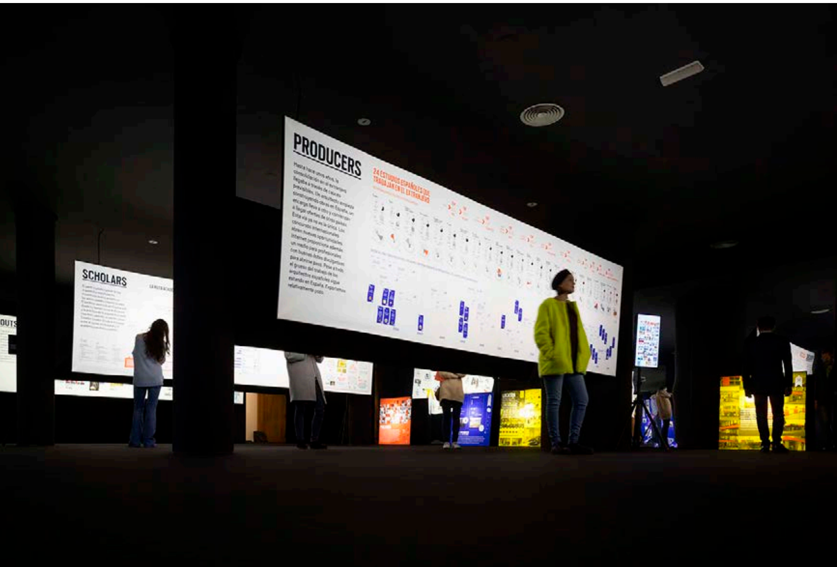
Export Spanish Architecture Abroad, 2015.