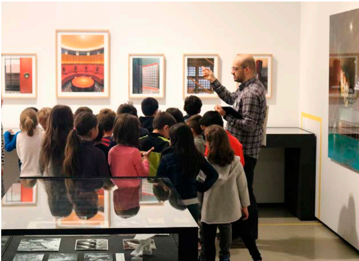
Taller para escolares de Primaria en la exposición «Vaquero Palacios. La belleza de lo descomunal», 2018.

Las Colecciones ICO y las exposiciones temporales sobre arte contemporáneo fueron protagonistas de este espacio durante una década aproximadamente hasta el inicio de una nueva línea expositiva en relación a la arquitectura, el diseño y el urbanismo. Con la llegada de este nuevo tiempo, se pretendió dinamizar la actividad del museo con el innovador objetivo de difundir ahora esta disciplina de las Bellas Artes, que en la capital no tenía su lugar.