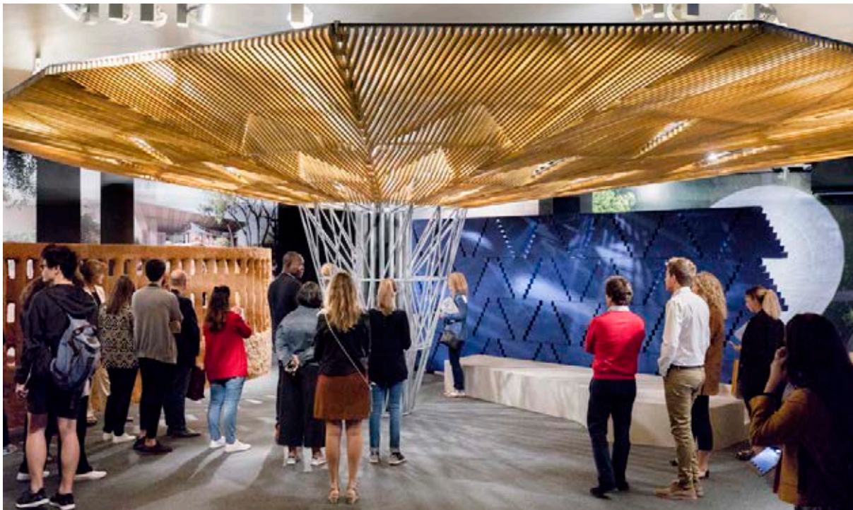
Exposición «Francis Kéré. Elementos Primarios».

S.N. (1996) «Doña Cristina presidió la apertura de la sala permanente del ICO» < http://hemeroteca.abc.es/nav/Navigate.exe/hemeroteca/madrid/abc/1996/03/29/055.html > [20 de septiembre de 2018]