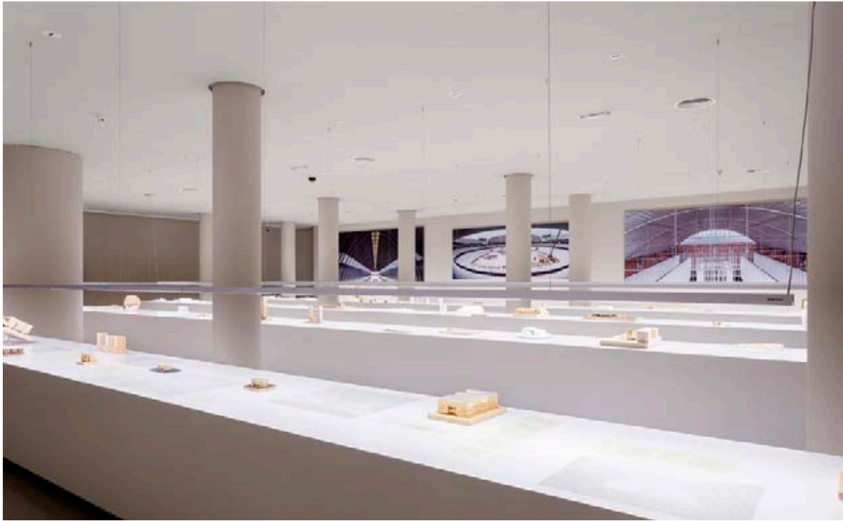
Imagen de la exposición retrospectiva de los arquitectos Cruz y Ortiz, 2016.

con cada una de las exposiciones que lleva a cabo, gracias al impulso que se le dio en 2012 al retomar la temática de la arquitectura y el urbanismo.