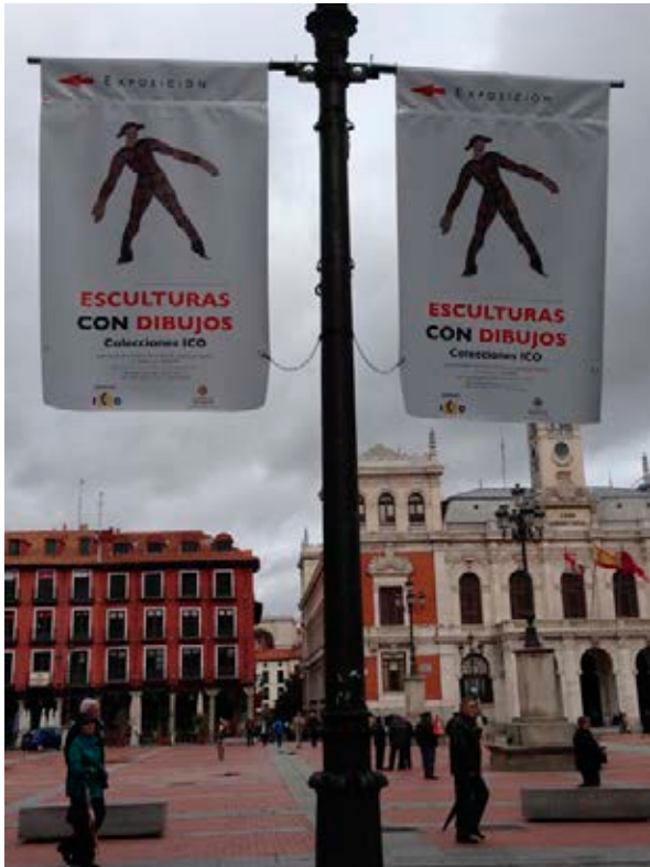
Colección de escultura moderna española con dibujo del Instituto de Crédito Oficial (ICO), una de las exposiciones itinerantes durante 2016.

Desde 2003 es una fundación pública estatal con carácter permanente y finalidad no lucrativa que desarrolla su actividad con el patrocinio único del Instituto de Crédito Oficial, y que además de contar con el Área de Arte, lleva a cabo numerosos proyectos desde diferentes áreas enfocados a la formación y promoción de la sociedad, entre las que destacan