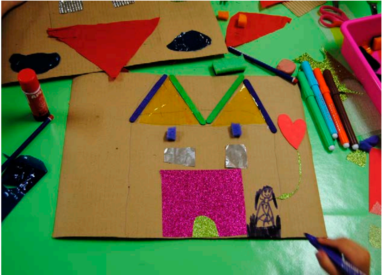
Actividad creativa en el Museo ICO.

las becas de estudios -principalmente financieros- en China y las becas de Formación Museográfica, además de programas de autoempleo y emprendimiento, y una línea editorial, todo esto siempre en relación con las líneas estratégicas del ICO.