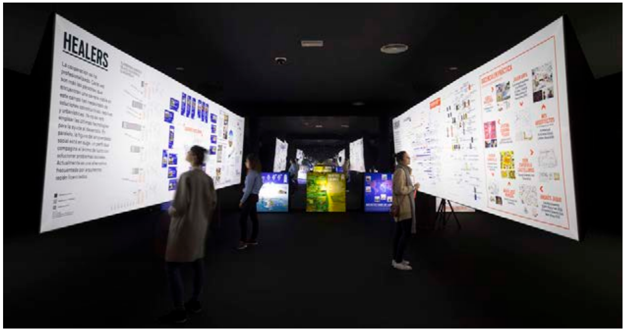
Export Spanish Architecture Abroad, 2015.

de Pintura española, centrada en los años ochenta, la colección de Escultura con Dibujo, que acoge todo el siglo xx y la Suite Vollard de Picasso, una de las pocas series completas que se conservan en el mundo 3 .