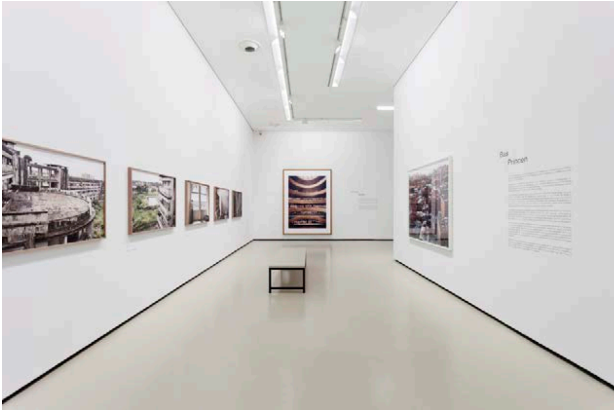
Fotografía y arquitectura moderna en España 1925-1965, PhotoEspaña, 2014.

punto actual tuvo que ver con una estrategia de captación de nuevos públicos, a tenor de los buenos resultados de algunas exposiciones sobre arquitectura y diseño en medio de una programación que giraba alrededor del arte contemporáneo español, tema principal de las colecciones del Instituto de Crédito Oficial. En concreto experiencias muy positivas como la muestra sobre Marcel Breuer o las famosas sillas Vitra hicieron repensar la línea a seguir, dada la gran oferta cultural existente sobre arte contemporáneo en las inmediaciones del museo.