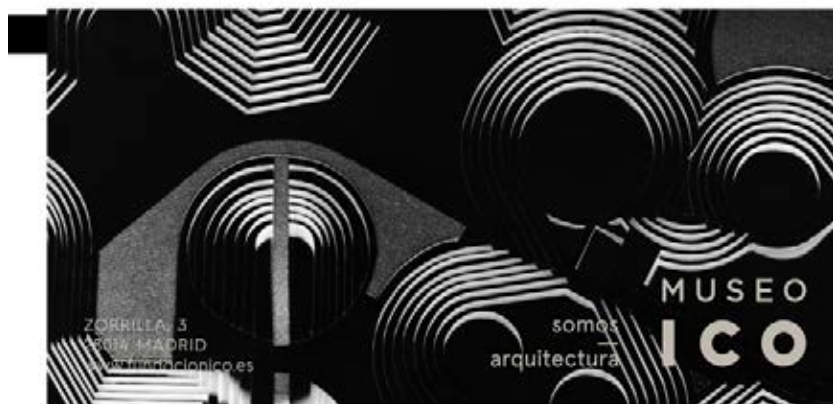
Exposición «Fernando Higuera. Desde el origen».

sectores demandantes a través de más convenios de colaboración y, sobre todo, la búsqueda de proyectos de inclusión absoluta, es decir, aquellos en los que no sea necesario segmentar, sino que consigan unir a públicos de distintas capacidades.