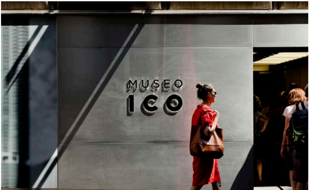
Entrada al Museo ICO.

Aunque poco a poco se va abriendo camino en el panorama museístico, este espacio de unos 1000 m 2 de exposición a la espalda del Congreso de los Diputados, es aún desconocido para el gran turismo que día tras día recorre el Paseo del Arte de la capital española, en busca de los icónicos museos del Prado, el Thyssen Bornemisza o el Reina Sofía.