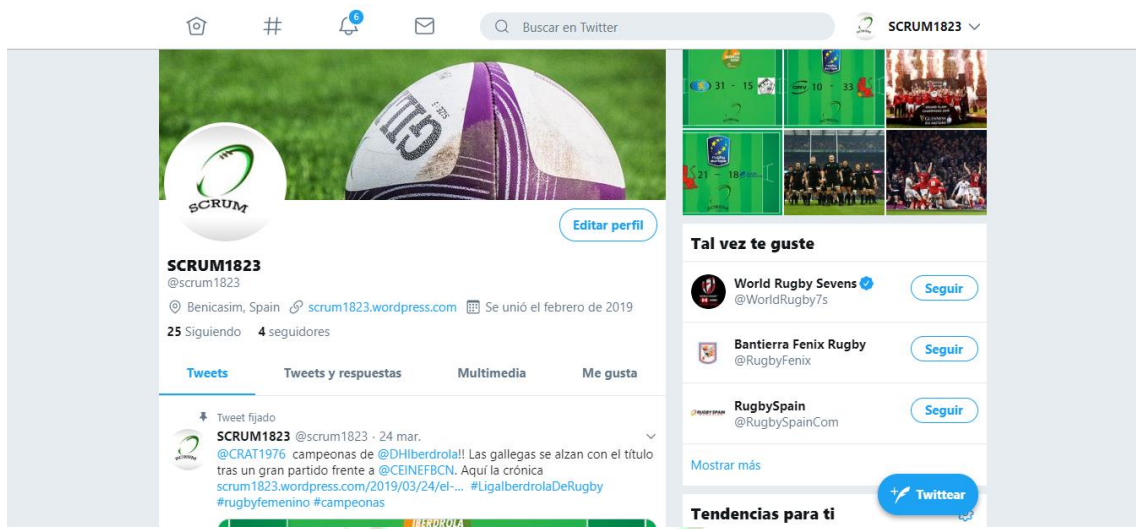
Ejemplo de promoción de una publicación