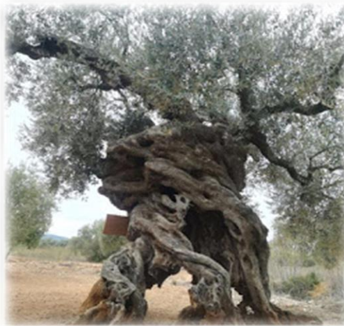
Figura 6. Punt 4: Olivera de les 4 potes

Continuem amb el recorregut i anem a l'Olivera de les 4 potes (Figura 6. Punt 4). Se li va donar aquest nom pel peculiar tronc que té en aquesta olivera hi haurà un codi QR i Oliveta ens explicarà en què consisteix la collita de les olives.