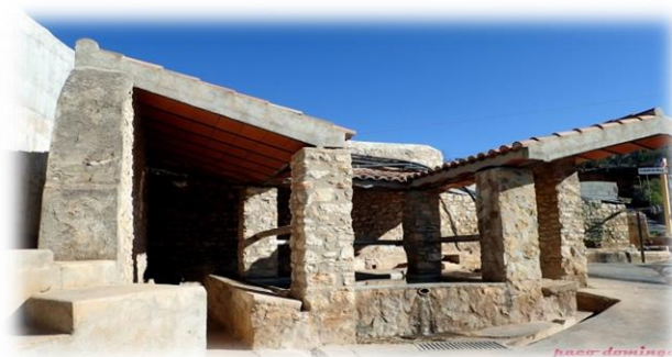
Figura 7. Punt 5: Font de la Canal

Ens dirigim cap a la Font de la Canal (Figura 7. Punt 5), una font rodejada per una gran quantitat d'oliveres. Aquí també trobarem un codi QR, els nens/es l'escanejaran i llavors Oliveta els explicarà en què consisteix el treball dels pagesos.