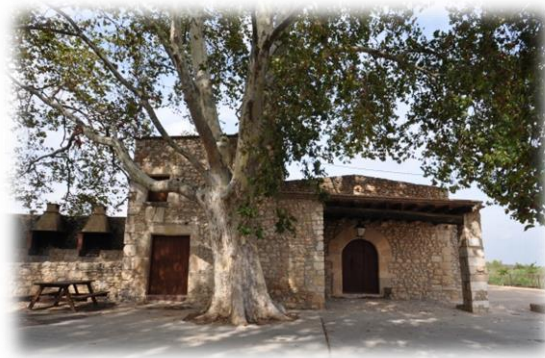
Figura 4. Punt 2: Ermita Santa Isabel Llombart de Canet lo Roig.

Una vegada formats els grups donarem pas al començament de l'itinerari. Ens dirigim cap a l'Ermida Isabel Llombart de Canet lo Roig (Figura 4. Punt 2), un recurs paisatgístic molt agradable per poder realitzar activitats a l'aire lliure. Hi podem trobar uns enormes arbres on en els seus respectius troncs els nens/es amb les seves respectius tablets, hauran d'escanejar un codi QR. Els sortirà un vídeo on la protagonista "Oliveta" els explicara en què consistirà aquest itinerari artístic, fent una petita explicació del que són les oliveres.