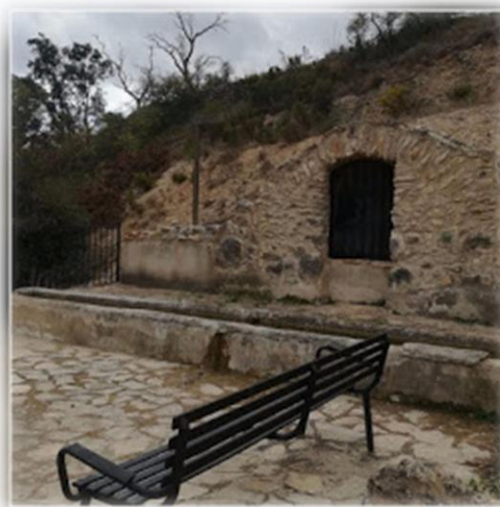
Figura 5. Punt 3: Font de la Fontanella

Sortim de l'Ermite amb les nostres bicicletes i ens dirigim gaudint de tot el paisatge que és trobarem durant el transcurs fins a arribar a la Font de la Fontanella (Figura 5. Punt 3). Hi trobaran un altre codi QR, on Oliveta explicara que és l'Oliva.