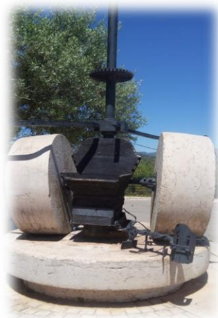
Figura 8. Punt 6: Les Moles

Continuem amb l'itinerari i arribem a l'últim lloc del recorregut que serà les Moles (Figura 8. Punt 6). Aquest racó del poble, és un molí antic. Pegat damunt hi haurà un codi QR, ens sortirà Oliveta fent l'explicació de l'Oli.