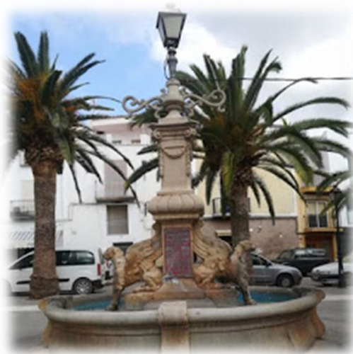
Figura 3. Punt 1: Plaça Nova Canet lo Roig

Punt de trobada: La sortida serà de la plaça Nova del poble (Figura 3. Punt 1), allí presentaré a la protagonista del recorregut "Oliveta", una motxilla en forma d'oliva que ens acompanyara durant tot l'itinerari artístic. Els nens/es acudiran al punt d'encontre amb els pares i amb les seues bicicletes, així el recorregut serà més divertit i podran realitzar-lo amb més rapidesa.