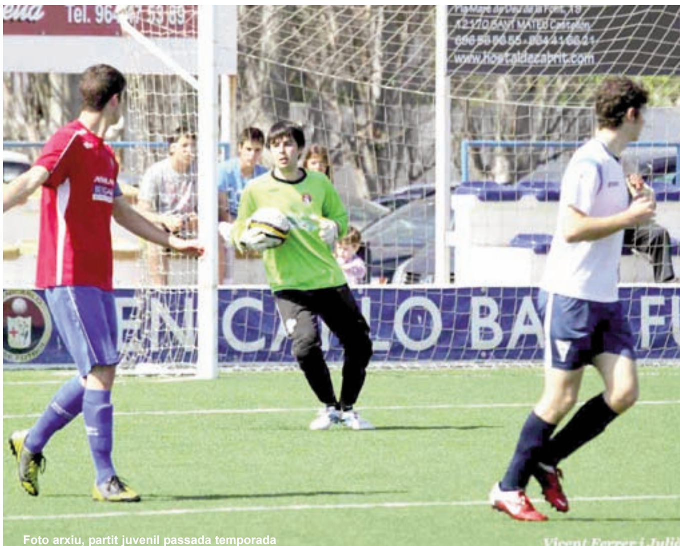
Foto arxiu, partit juvenil passada temporada