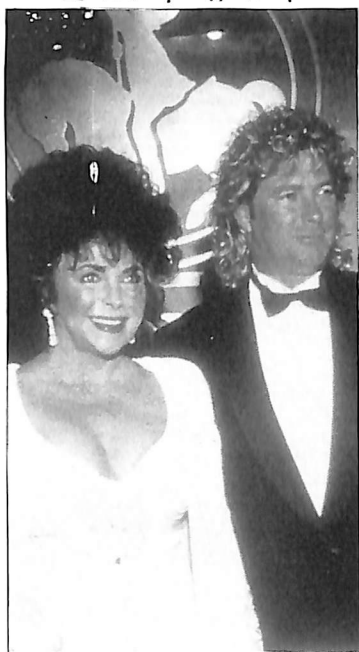
SE BUSCA MARIDO PARA COMPLETAR COLECCIÓN