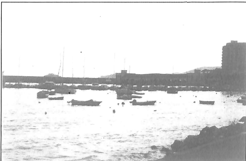
Denuncias de pesca ilegal en Benicarló.