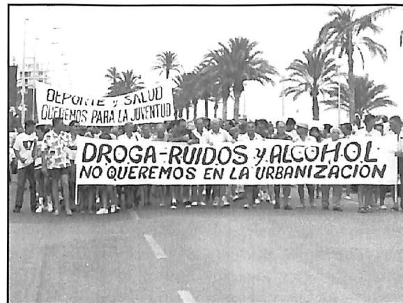
Manifestación realizada por los vecinos el verano pasado

Los vecinos han adoptado esta medida de presión hacia el consistorio peñiscolano, ya que no se ha llevado a cabo el cierre de los pubs que no cumplen con la legislación vigente, tal como han venido solicitando continuamente.