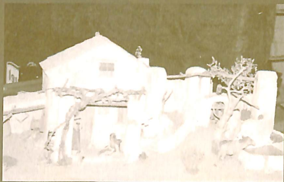
La sènia de Pau